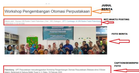
Gambar 1.1 Contoh judul, foto berita dan captions yang sudah editing dan di posting di website

Gambar di bawah ini akan menjelaskan detail headline, inti dan teks utama berita tersebut..