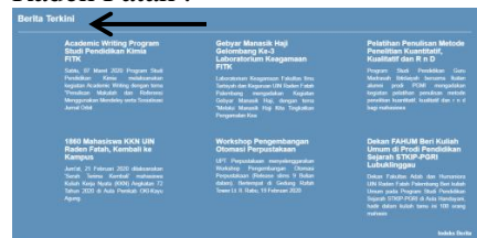
Gambar 1.3 Bagian Tampilan awal pada berita terkini di website UIN Raden Fatah Palembang

Halaman ini memuat berita-berita terbaru seputar acara di UIN Raden Fatah, serta Jam Sholat 5 waktu untuk kota Palembang dan sekitarnya, serta melalui email facebook UIN Raden Fatah .