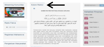
Gambar 1.4 Kolom rektor yang ada di website UIN Raden Fatah

Kolom rektor berisi tulisan rektor dan asisten rektor; postingan ini sesuai dengan kata-kata yang disampaikan oleh rektor dan wakil rektor bersama yang akan dipublikasikan nanti di halaman ini, sehingga bisa dilihat kembali di halaman ini. bir penjaga itu seperti kanselir. Upacara Wisuda UIN Raden Fatah.