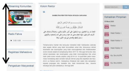
Gambar 1.5 bagian kolom hiburan pada website UIN Raden Fatah

Salah satu kelebihan website UIN Raden Fatah ialah adanya hiburan berupa siaran langsung dan layar radio, saat ini live streaming ini biasanya acara-acara besar yang diselenggarakan oleh UIN Raden Fatah, salah satu contohnya bekerjasama dengan Rafa TV yang dijalankan oleh Fakultas pada saat wisuda, UIN Raden Fatah Komunikasi Dakwah. Ngomong-ngomong, hiburan lainnya ialah radio yang bisa didengar saat kita membuka website UIN Raden Fatah. Seperti halnya siaran langsung yang telah dijelaskan sebelumnya, radio dijalankan oleh dakwah dan fakultas komunikasi sehingga jika kita membuka website UIN kita dapat mendengar siaran radio secara bersamaan saat kita sedang online.