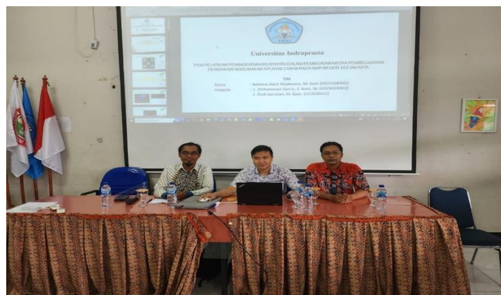
Gambar 1. Tim Pengabdian Masyarakat

Materi yang disajikan terkait dengan pengenalan dan penggunaan Canva Penyaji materi adalah Tim Pengabdian Masyarakat Universitas Indraprasta PGRI Pada Gambar 1. Sebelumnya Tim telah disesuaikan dengan bidang dan keahlian masing-masing. Pada saat materi yang disajikan sebanyak 2 (dua) jenis bahasan yang dijabarkan pada Tabel 1 dibawah ini.