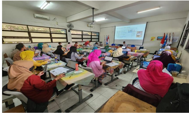
Gambar 2. Peserta Kegiatan Pengabdian Masyarakat

Kegiatan yang dilaksanakan selama 4 hari, dihadiri oleh peserta sebanyak 25 orang pendidik berikut dokumentasi kegiatan Pengabdian Masyarakat..