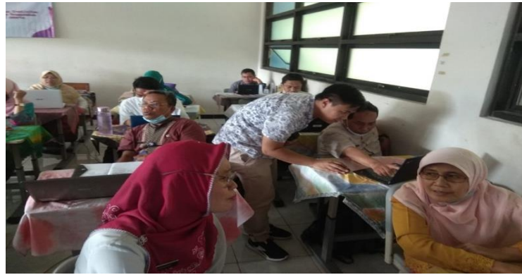
Gambar 5. Pendampingan Kegiatan oleh tim