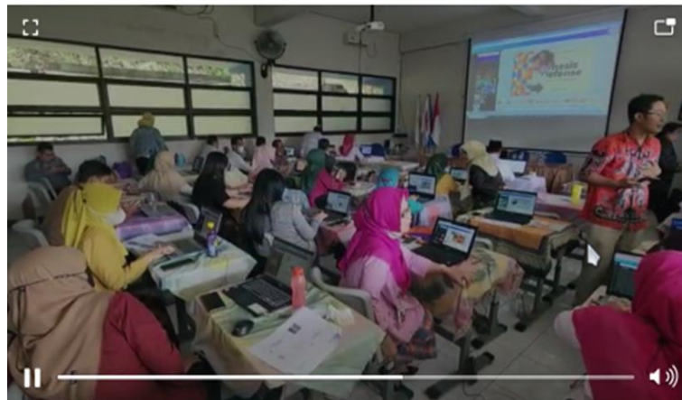
Gambar 3. Penyampaian Materi Kegiatan Pengabdian Masyarakat