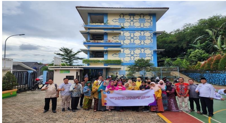
Gambar 6. Foto Penutupan Kegiatan Pengabdian Masyarakat dengan peserta

Pencapaian hasil kegiatan dari Pengabdian Masyarakat sama dengan kesimpulan yang terdiri dari pro dan kontra [5]: