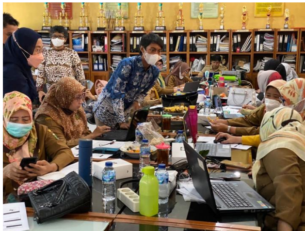
Gambar 4. Diskusi Antar Peserta

Gambar 3 menampilkan tim membantu peserta dalam menyiapkan software Mendeley pada laptop peserta masing-masing. Pendampingan juga terus dilakukan oleh tim, selama peserta melakukan praktik dalam penggunaan dan manfaat software Mendeley.