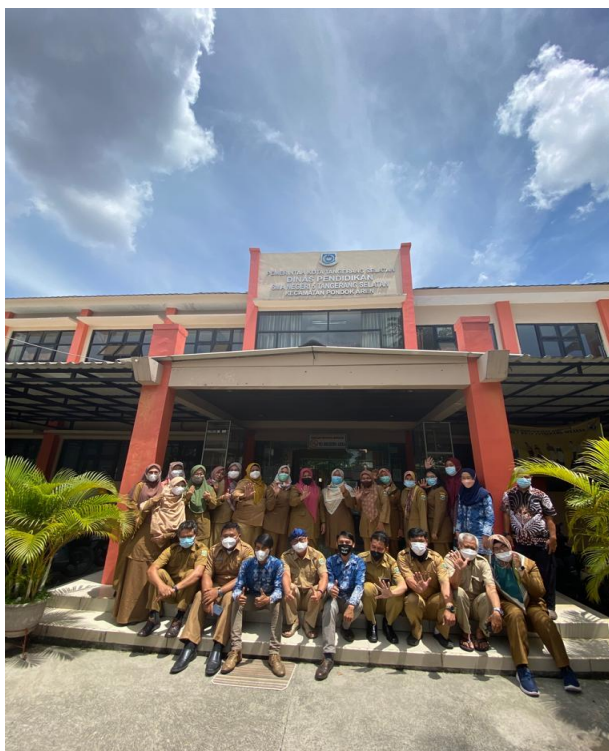
Gambar 5. Tim dan Peserta Pengabdian Kepada Masyarakat

Gambar 4 menggambarkan beberapa peserta sedang melakukan diskusi terhadap materi yang disampaikan. Dalam hal ini tentunya Tim Abdimas dengan sigap membantu peserta apabila peserta memberikan pertanyaan maupun terdapat permasalahan selama kegiatan berlangsung.