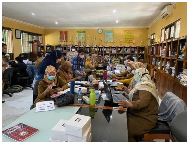
Gambar 3. Praktik dalam penggunaan Software Mendeley

Gambar 2 menggambarkan Tim sedang menyampaikan materi mengenai software Mendeley. Dalam tahap penyampaian materi ini, salah satu anggota tim juga berada di tengah-tengah peserta untuk hal pendampingan selama penyampaian materi berlangsung.