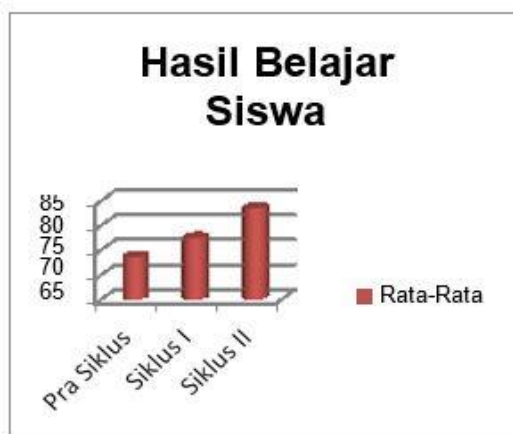
Gambar 2. Hasil rata-rata belajar siswa

Pada siklus I mengalami peningkatan rata-rata nilai hasil belajar menjadi 77.4 dan persentase ketuntasan klasikal menjadi 79.3%. Pada siklus II rata-rata nilai hasil belajar 83.4 persentase ketuntasan klasikal hasil belajar peserta didik, yakni 86.2%. Peningkatan hasil belajar ini tidak lepas dari proses pembelajaran yang semakin baik sehingga memberikan dampak positif terhadap hasil belajar peserta didik. Hal ini karena proses dan hasil belajar memiliki hubungan yang erat.