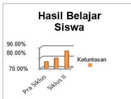
Gambar 3. Hasil ketuntasan belajar siswa