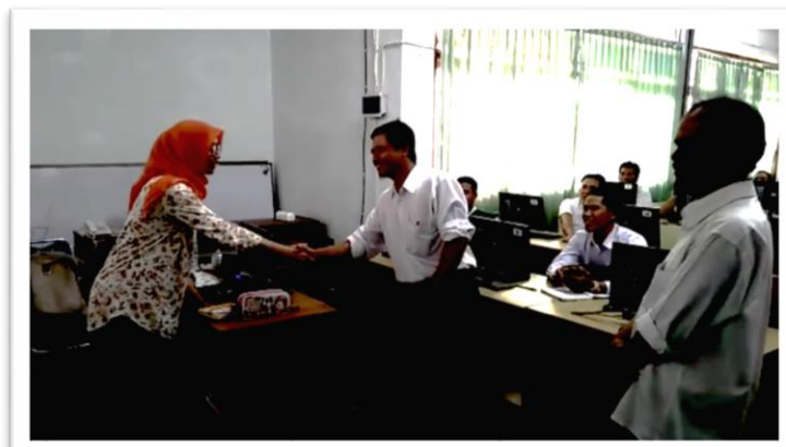
Gambar 4. Peserta belajar dengan metode collaborative learning

dengan pengajar dan teman. Pengajar/instruktur menjadi bagian dari kelompok besar untuk memberikan contoh. Pengajar memberikan pertanyaan, seperti “where is Room A12?” kemudian peserta akan menjawab “sebelah or beside room A11, bu.” Dengan metode seperti ini, peserta memahami apa yang harus dilakukan di kegiatan berikutnya. Berikut adalah gambar penggunaan metode collaborative learning.