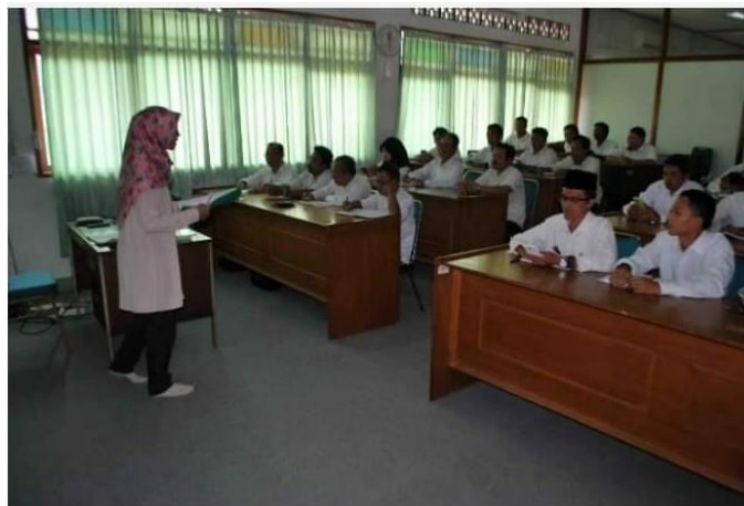
Gambar 2. Suasana pelatihan hari ke-1

Materi yang diberikan di hari pertama ini adalah materi tentang greeting dan parting