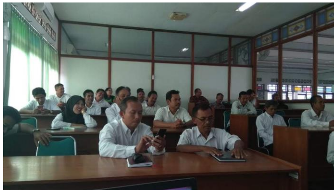
Gambar 1. Peserta Pelatihan

dan materi inti pelatihan. Di hari pertama ini, para peserta datang tepat waktu sehingga acara pelatihan dapat berjalan sesuai jadwal yang telah direncanakan. Peserta pelatihan mengenakan seragam atasan putih dan bawahan hitam untuk mengawali pelatihan ini. Peserta terlihat antusias saat memasuki ruangan pelatihan. Beberapa dari peserta bahkan sudah menggunakan bahasa Inggris untuk menyapa instruktur/pemateri. Para peserta tidak jarang pula melontarkan guyonan-guyonan agar suasana kelas menjadi lebih hidup dan tidak kaku.