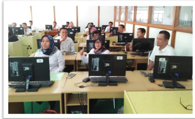
Gambar 4. Peserta Pelatihan hari kedua

mengikuti pelatihan tampak sangat jelas. Terlihat antusiasme peserta setelah menyelesaikan pelatihan semakin tinggi seperti tampak pada gambar 4 berikut.