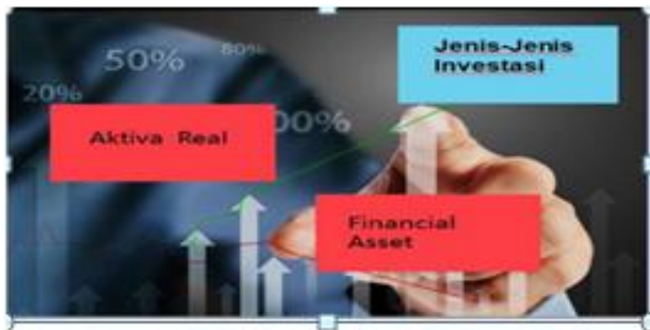
Gambar 4 Materi pertama yang di sampaikan oleh Iroh Rahmawati

Dampak terjadinya pandemik covid-19 masih dirasakan seluruh masyarakat di dunia. Kebijakan pembatasan kegiatan masyarakat selama dua tahun lebih yang bertujuan untuk meredam penyebaran covid-19 sangat mempengaruhi roda perekonomian. Terjadinya stagflasi ekonomi membuat banyak pengusaha mengalami kebangkrutan. Beruntung, pemerintah Indonesia cepat mengambil tindakan antisipasi penyebaran covid-19, sehingga pemulihan kesehatan masyarakat terhadap serangan bahaya covid-19 cepat teratasi. Pemerintah Indonesia bersama DPR melalui Undang-Undang nomor 2 tahun 2020 yang menetapkan Perpu Nomor 1 Tahun 2020 menjadi UU, mengatur kebijakan keuangan negara dalam rangka menghadapi ancaman yang membahayakan perekonomian nasional dan/atau stabilitas sistem keuangan. Keberhasilan Indonesia dalam pemulihan kesehatan dari pandemik covid-19 mendapat pengakuan dunia, dan menjadi contoh bagi negara lainnya. Dengan