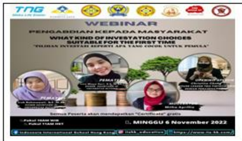
Gambar 3 Flyer Kegiatan Pengabdian Kepada Masyarakat