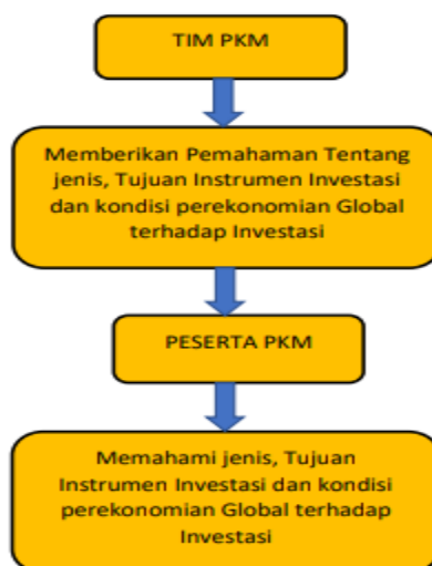
Gambar 2. Kerangka Pemecahan Masalah

bertahan dan masih memiliki pendapatan. Apalagi dilihat kondisi ekonomi Global yang akan terjadi resesi sehingga pengetahuan investasi yang aman pada masa resesi perlu dilakukan. Metode yang akan digunakan dalam pengabdian masyarakat terlihat pada gambar 2 ini yaitu: