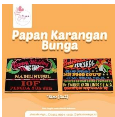
Gambar 2. Produk papan karangan bunga

Papan karangan bunga adalah karangan bunga yang disusun menjadi bentuk tertentu di atas papan gabus. Produk papan karangan bunga dari Plaza Bunga memiliki beragam ukuran dengan bahan gabus. Harga jual papan karangan bunga mulai Rp350.000 sampai Rp2.000.000. Selain itu Plaza Bunga menyediakan jasa rental/sewa khusus untuk produk karangan bunga.