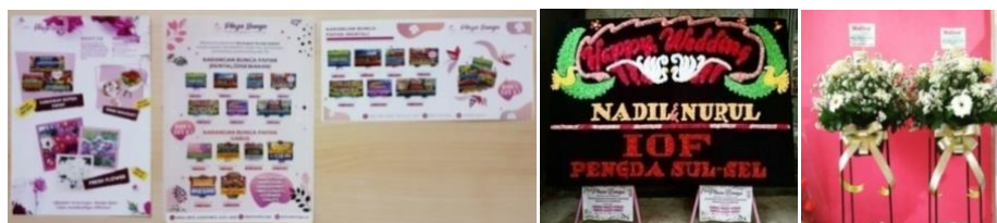
Gambar 6. Spanduk dan stiker plaza bunga

Kegiatan selanjutnya adalah melakukan promosi dan distribusi produk sesuai pesanan. Kegiatan promosi pada pemasaran offline biasanya dilakukan dengan pembagian atau pemberian brosur kepada para konsumen yang datang ke toko dan pemasangan spanduk pada produk papan karangan bunga atau pemasangan stiker pada produk karangan bunga lainnya.