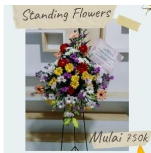
Gambar 3. Produk standing flower

Produk standing flower dari Plaza Bunga menggunakan bunga artifisial. Harga jual untuk produk ini mulai Rp750.000/produk.