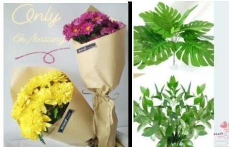
Gambar 4. Produk fresh flower

Produk fresh flower dari Plaza Bunga menyediakan bunga potong dari jenis bunga krisan, daun ruscus dan daun pillow. Harga jual bunga krisan mulai Rp6.000/potong, daun ruscus dan daun pillow Rp16.000/ikat.