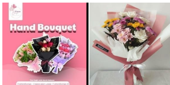
Gambar 1. Produk hand bouquet

Hand bouquet adalah karangan bunga yang terdiri dari beberapa jenis bunga dan dedaunan yang dirangkai sedemikian rupa menjadi satu genggamannya atau sering disebut bunga tangan. Produk Hand bouquet dari Plaza Bunga memiliki 2 jenis yaitu bouquet artifisial (buket bunga hiasan) dan bouquet fresh flower (buket bunga segar). Hand bouquet dijual dengan harga mulai Rp100.000/buket sesuai ukuran dan jenis buket.