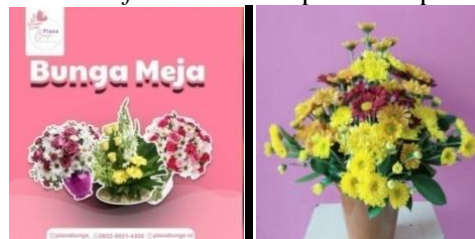
Gambar 5. Produk table flower

Produk table flower dari Plaza bunga memiliki 2 jenis bunga yaitu bunga segar ( fresh flower ) dan juga bunga artificial. Harga jual produk table flower mulai Rp250.000/pot