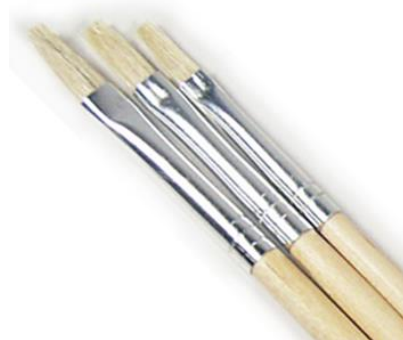
Gambar 2. Cat Deco Textile

Gambar 3. Kuas Untuk Melukis Kelebihan Cat Duco Textile adalah pada hasil yang cenderung lebih lembut, dan mengikuti tekstur kain, serta mudah diaplikasikan pada kain dan cepat mengering