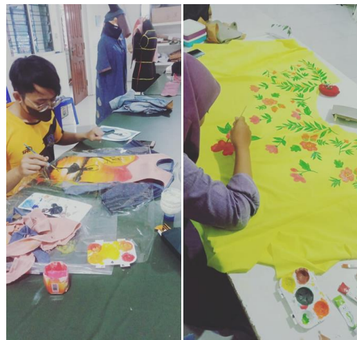
Gambar 4. Praktikum Teknik Lukis pada kain

Gambar 3. Kuas Untuk Melukis Kelebihan Cat Duco Textile adalah pada hasil yang cenderung lebih lembut, dan mengikuti tekstur kain, serta mudah diaplikasikan pada kain dan cepat mengering