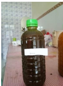
Gambar 4. Jamu dengan gula stevia

Hasil uji organoleptik jamu tradisional dengan penambahan gula stevia sebanyak 30gr memiliki hasil dengan rata – rata jawaban responden yaitu memiliki aroma menyengat seperti daun teh, rasa yang manis cenderung pahit, warna coklat gelap, dan memiliki tekstur yang kental. Penambahan gula stevia pada jamu tradisional kunyit asam ini dinilai tidak efektif karena rasa yang cenderung pahit, dan warna yang kurang menarik seperti pada gambar 4.