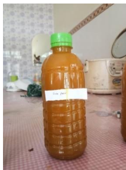
Gambar 2. Jamu dengan gula tebu

Hasil uji organoleptik jamu tradisional dengan penambahan gula tebu sebanyak 30gr memiliki hasil dengan rata – rata jawaban responden yaitu memiliki aroma alami kunyit, rasa yang cukup manis, warna kuning cerah dan memiliki tekstur yang cair. Penambahan gula tebu pada jamu tradisional di nilai kurang efektif karena rasa yang terkesan memiliki sedikit manis dan warna yang kurang menarik seperti pada gambar 2. Sehingga membutuhkan banyak gula tebu dalam pembuatan jamu tradisional.