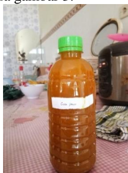
Gambar 3. Jamu dengan gula jawa

Hasil uji organoleptik jamu tradisional dengan penambahan gula jawa sebanyak 30gr memiliki hasil dengan rata – rata jawaban responden yaitu memiliki aroma menyengat kunyit gula jawa, rasa yang manis, warna kuning gelap, dan memiliki tekstur yang cair. Penambahan gula jawa pada jamu tradisional kunyit asam ini dinilai lebih efektif, daripada penambahan gula tebu pada jamu tradisional tersebut karena rasa yang manis dan warna yang lebih menarik seperti pada gambar 3.