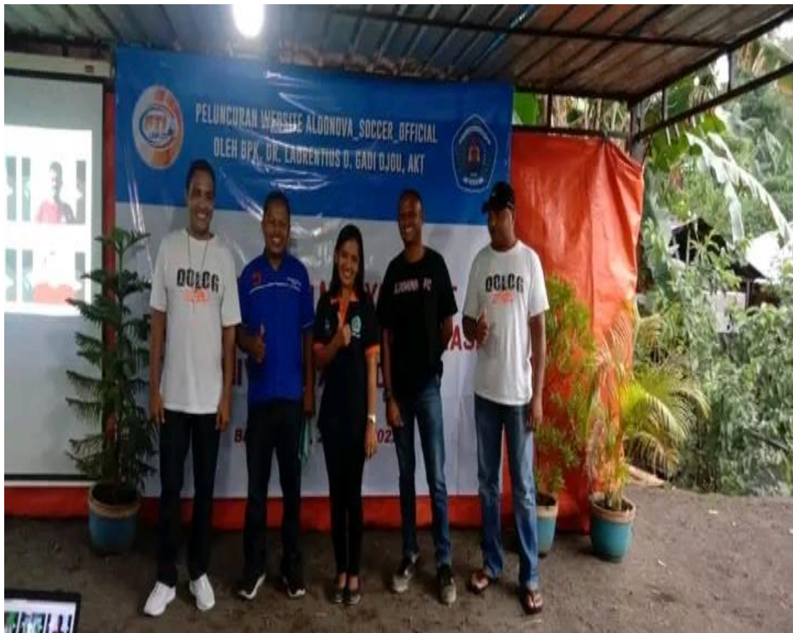
Gambar 2. Dokumentasi Kegiatan Sosialisasi