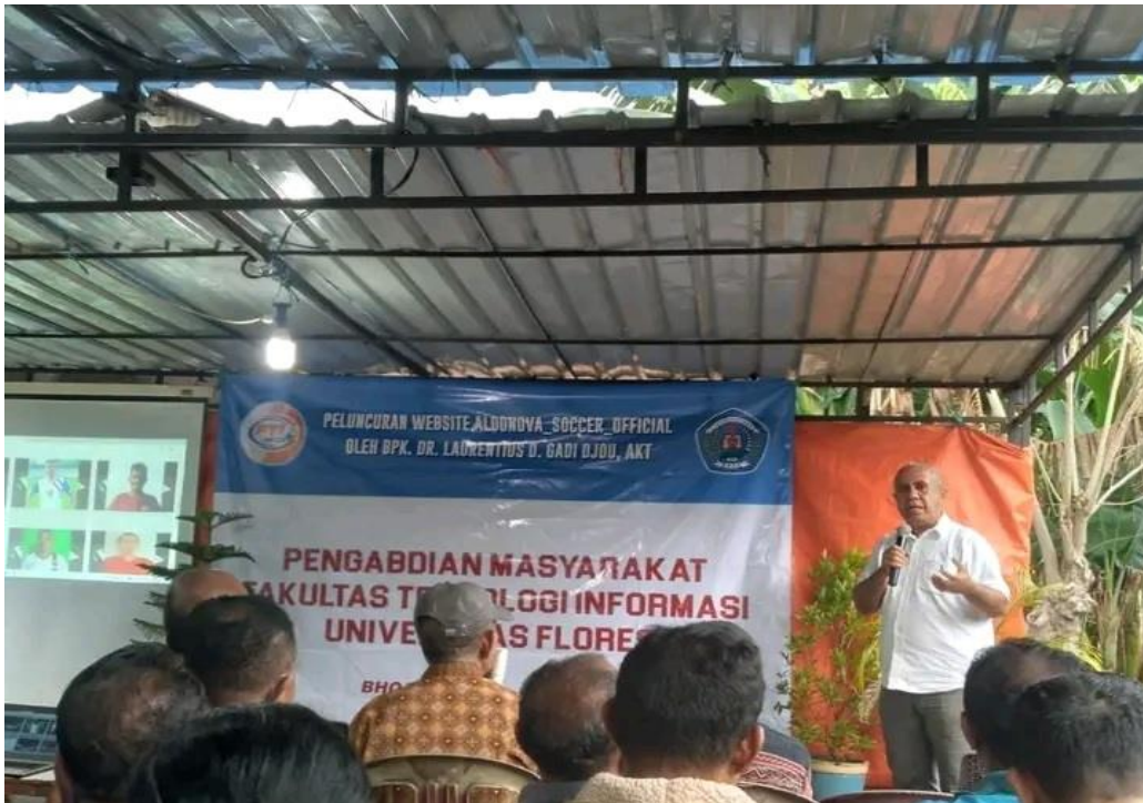
Gambar 1. Sosialisasi Penggunaan Website

Evaluasi dilakukan untuk melihat tindak lanjut dari kegiatan yang sudah dilaksanakan, apakah para pengurus sepak bola Aldonova FC mampu menggunakan fitur-fitur website tersebut dengan baik.