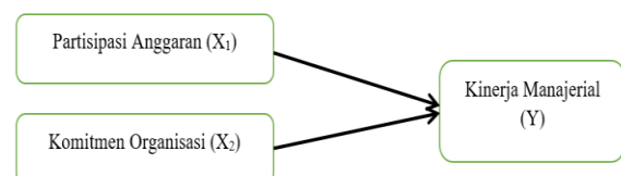
Gambar 1. Model Konseptual Penelitian