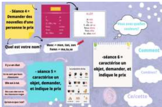
Gambar 2. Konten Jamboard Mahasiswi Isna Salsabila

Berdasarkan hasil yang terlihat, sebagian besar mahasiswa membuat konten Jamboard yang sangat kreatif dan cukup menjelaskan bagaimana pemahaman tata bahasa Perancis yang mereka miliki. Hasil karya-karya tersebut sangat dapat dimanfaatkan untuk pembelajaran serupa pada angkatan mahasiswa dan tahun ajar berikutnya dalam hal memudahkan pemahaman tata bahasa Perancis melalui pemberian gambaran materi-materi yang akan diajarkan selama satu semester.