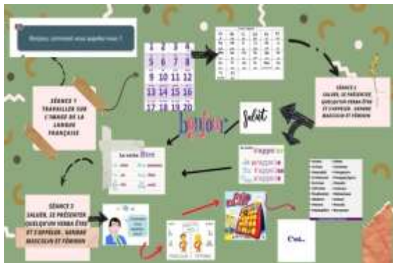
Gambar 3. Konten Jamboard Mahasiswi Riski Widya Sabrina