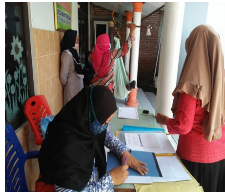
Gambar 1. Pendaftaran dan pelaksanaan posyandu di balai desa

Kegiatan pengabdian kepada masyarakat diawali dengan melakukan observasi di balai desa pada acara posyandu dan mengisi daftar hadir kemudian dilakukan identifikasi hasil penimbangan berat badan dan pengukuran tinggi badan pada balita, setelah itu hasil yang didapatkan disampaikan kepada orang tuanya untuk diberikan penyuluhan nutrisi tentang tumbuh kembang balita dengan buku KIA dan ditindaklanjuti dengan mengunjungi rumah balita pada kasus kurang gizi dan gizi buruk.