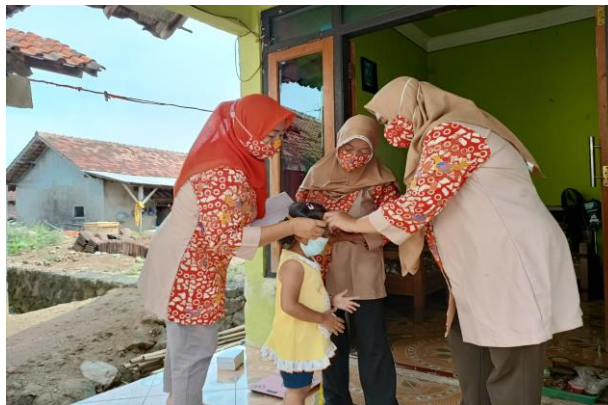
Gambar 3. Pengukuran Lingkar kepala balita di rumah

Pengabdian masyarakat yang dilakukan sesuai rencana yaitu pada bulan Februari yang bersamaan dengan program pemberian vit A oleh kader kesehatan dan petugas puskesmas. Apabila balita yang datang ke posyandu di layani dari penimbangan berat badan dan di lakukan penjelasan tentang pertumbuhan dan perkembangan balita sesuai dengan umur balita. Bila balita dari hasil penimbangan dan pertumbuhannya di bawah standar atau tidak sesuai buku KIA maka perlu dilakukan pendampingan dengan pelatihan dan pembinaan kader agar bisa melaksanakan sendiri bila masih terdapat kasus pertumbuhan dan perkembangan balita di bawah normal ( gizi kurang/ gizi buruk).