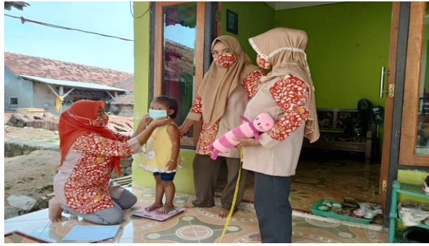
Gambar 2. Penimbangan balita di Rumah