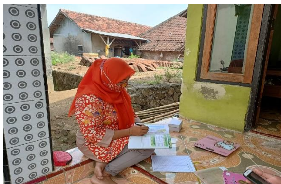
Gambar 4. Pencatatan dan analisa hasil penimbangan dan pengukuran balita di rumah

Pengabdian masyarakat yang dilakukan sesuai rencana yaitu pada bulan Februari yang bersamaan dengan program pemberian vit A oleh kader kesehatan dan petugas puskesmas. Apabila balita yang datang ke posyandu di layani dari penimbangan berat badan dan di lakukan penjelasan tentang pertumbuhan dan perkembangan balita sesuai dengan umur balita. Bila balita dari hasil penimbangan dan pertumbuhannya di bawah standar atau tidak sesuai buku KIA maka perlu dilakukan pendampingan dengan pelatihan dan pembinaan kader agar bisa melaksanakan sendiri bila masih terdapat kasus pertumbuhan dan perkembangan balita di bawah normal ( gizi kurang/ gizi buruk).