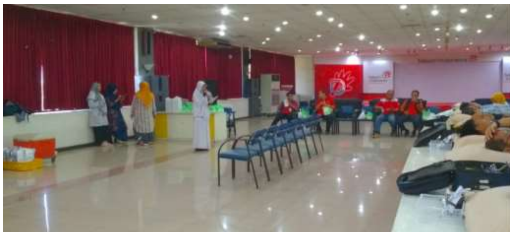
Gambar 2. Kegiatan Sosialisasi Persyaratan Kegiatan Donor Darah Instansi (Mobile Unit) dan Donor Darah Mobile Unit di Grapari Telkom Surabaya