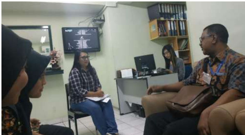
Gambar 1. Survei lokasi Sosialisasi Persyaratan Kegiatan Donor Darah Instansi (Mobile Unit) di Grapari Telkom Surabaya

Dengan adanya kegiatan sosialisasi persyaratan kegiatan donor darah ini, masyarakat dapat mengetahui proses pengambilan darah serta penyimpanannya sehingga menimbulkan rasa ingin berbagi dengan mendonorkan darah kepada sesama yang membutuhkan darahnya secara sukarela. Dan tentunya kegiatan ini dapat menarik minat donor darah sehingga dapat membantu memenuhi kebutuhan stok di UTD PMI Kota Surabaya.