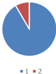
Gambar 2. Penggunaan bahan ajar dari Big Data