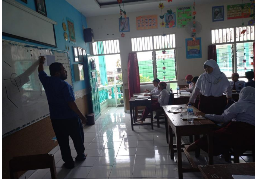
Gambar 2. Kegiatan Belajar Mengajar

Sesuai dengan observasi dan dokumentasi bahwa guru dalam melakukan proses pembelajaran tidak menggunakan media pembelajaran. Gambar diatas guru menjelaskan materi pengukuran sudut hanya dengan menggunakan metode ceramah saja. Peneliti juga menanyakan kepada siswa dalam wawancara dibawah ini sebagai berikut: