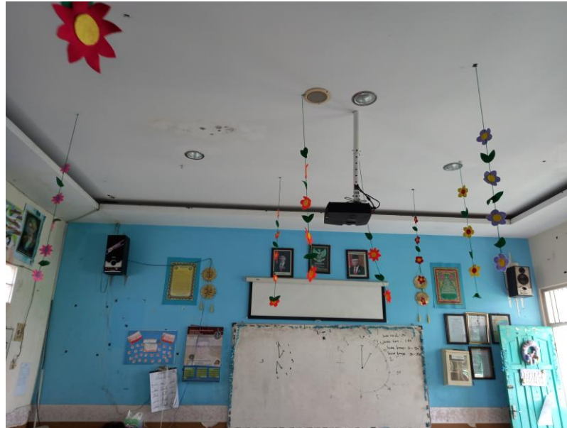
Gambar 3. Kondisi Kelas 4B

Temuan kedua, gambar diatas menggambarkan bahwa kondisi ruang kelas 4B Sokolah Dasar (SD) Islam Plus Muhajirin terlihat menarik. Kelas yang penuh warna menjadikan siswa seharusnya tidak cepat merasa bosan ketika siswa didalam kelas. Namun hal ini tidak sesuai dengan hasil wawancara peneliti dengan siswa, hasil wawancara siswa sebagai berikut: