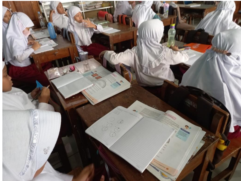
Gambar 4. Kegiatan Belajar Siswa

Peneliti dalam melakukan penelitiannya menyesuaikan materi di sekolah, maka ditemukanlah materi pengukuran sudut yang menjadi salah satu kesulitan bagi siswa. 25 siswa yang diwawancarai oleh peneliti, 22 siswa merasa materi pengukuran sudut itu sulit. Kesulitan materi pengukuran sudut bagi siswa yaitu karena dalam mengerjakan soal tes dengan cara mengukur dan menggunakan garis busur dalam mengerjakannya. Banyak siswa yang tidak membawa garis busur.