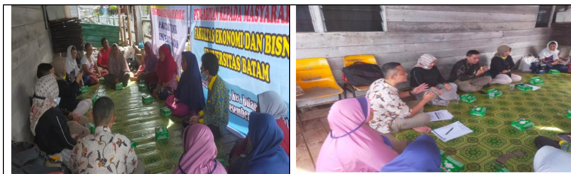
Gambar 3 Pemaparan pentingnya desain kemasan yang menarik

Dari segi kemasan ikan tamban menari, melalui kegiatan ini mitra mendapat pengetahuan bagaimana membuat kemasan ikan tamban menari yang menarik, baik dari unsur bahan kemasan, desain kemasan ( bentuk dan gambar/tulisan). Ditambah lagi pelaku UMKM belum paham terkait dengan logo usaha, sehingga disarankan agar memiliki logo sebagai identitas produk tersebut.