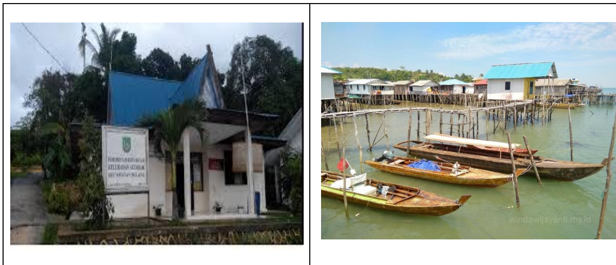
Gambar 1 Kelurahan Setokok