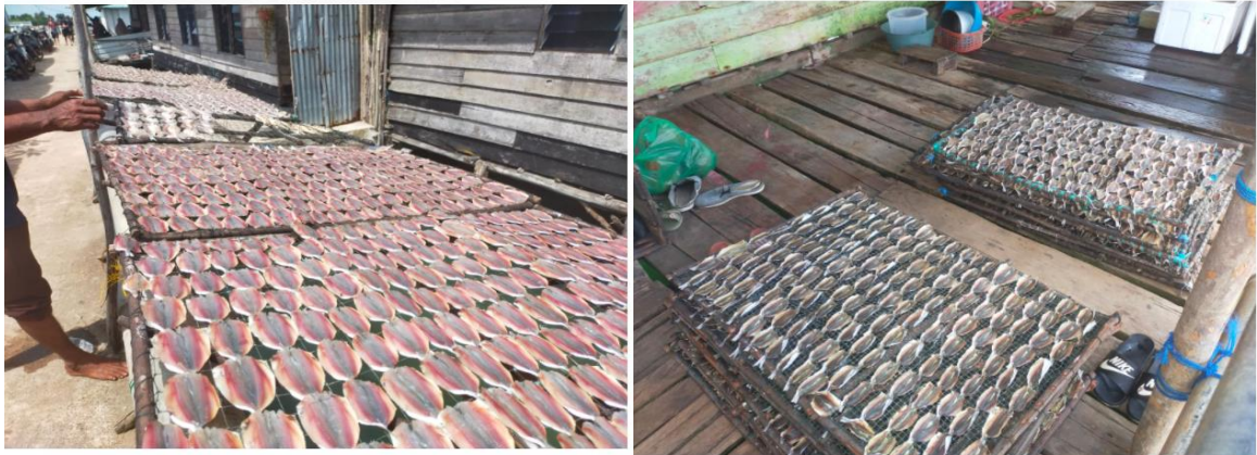
Gambar 2 Proses Pengeringan Ikan Tamban Menari secara tradisional