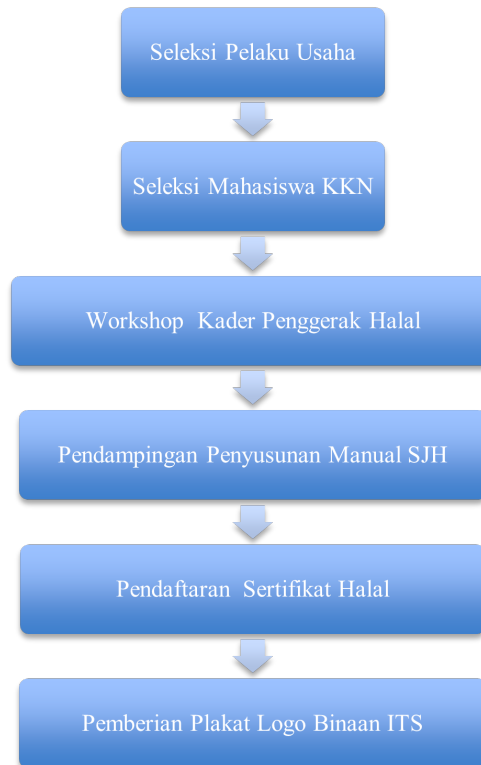
Gambar 1 Metode Pelaksanaan.

Dalam melaksanakan kegiatan pengabdian masyarakat ini, diawali dengan kegiatan sosialisasi yang pernah dilakukan oleh pelaku pengabdian masyarakat sebelumnya [8] dibantu oleh organisasi masyarakat, yaitu Ikatan Sarjana Nahdlatul Ulama (ISNU) Surabaya dan Kolaboratif Aktif Jejaring Informatif (KAJI). Kegiatan ini dilakukan sebagai tahap awal untuk proses penyampaian program, dan seleksi usaha mikro kecil (UMK) calon binaan pusat kajian halal ITS. UMK digolongkan menjadi 3 level, yaitu level A (UMK yang sudah mempunyai nomor ijin berusaha (NIB), ijin edar, dan/atau laik higiene sanitasi); level B (UMK yang sudah mempunyai NIB); dan level C (UMK yang belum mempunyai nomor pokok wajib pajak, NPWP). Selanjutnya, dituliskan dalam bentuk proposal pengabdian masyarakat sesuai panduan pada tautan https://www.its.ac.id/pkh/id/penerimaan-proposal-hibah/ .