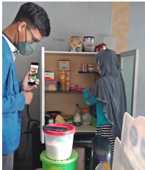
Gambar 5 Kegiatan verifikasi dan validasi pendamping PPH.