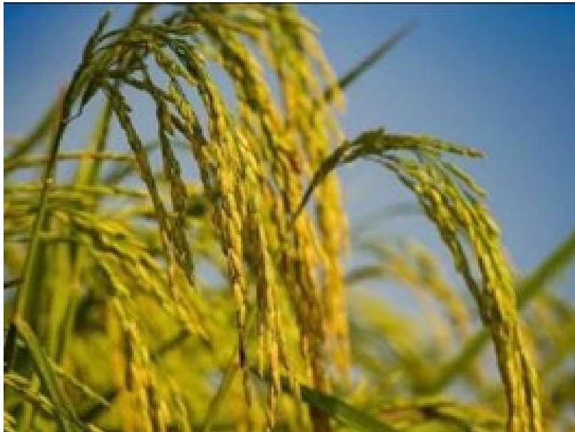
Gambar 1 Tanaman Padi [5] .

Tanaman padi ( Oryza sativa L. ) merupakan sumber pangan utama penduduk Indonesia, yang sebagian besar dibudidayakan sebagai padi sawah. Karena merupakan makanan utama penduduk Indonesia maka beras harus tersedia selalu. Dalam upaya pencapaian target program peningkatan produksi beras nasional (P2BN) pemerintah dalam hal ini Departemen Pertanian melalui badan pengembangan dan penelitian telah banyak mengeluarkan rekomendasi untuk diaplikasikan oleh petani [1, 2] . Salah satu rekomendasi ini adalah sistem tanam yang benar dan baik melalui pengaturan jarak tanam yang dikenal dengan sistem tanam jajar legowo. Karena sistem tanam jajar legowo telah terbukti dapat meningkatkan hasil panen hingga 30% [3, 4] .