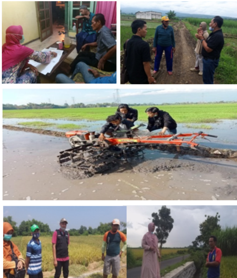
Gambar 4 Pelaksanaan Abmas kemitraan petani NU Jatirejo.