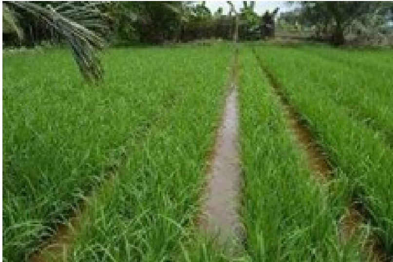
Gambar 3 Jajar Legowo [3] .