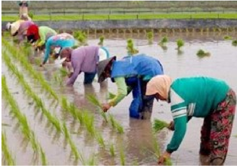
Gambar 2 Petani Menanam padi secara konvensional [4] .

masyarakat petani dengan harapan dapat meningkatkan produktifitas, mempersingkat waktu tanam, hemat biaya serta dapat dikembangkan oleh para petani itu sendiri dengan harga yang cukup terjangkau.