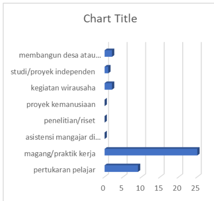
Gambar 2. Minat mahasiswa prodi Perbankan Syariah terhadap Bentuk Program MBKM

Berdasarkan hasil survey MBKM kepada beberapa sampel mahasiswa perbankan syariah terhadap beberapa program MBKM dapat digambarkan sebagai berikut: