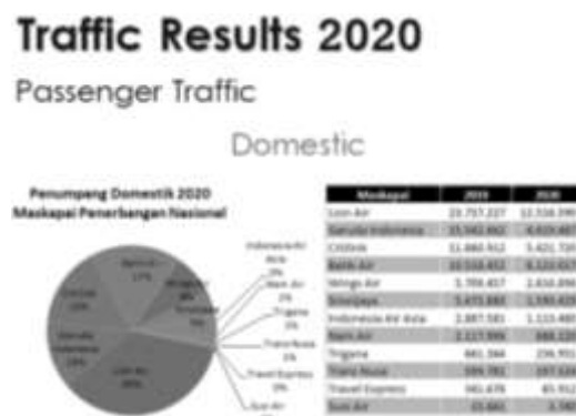
Gambar 1. Traffic Results 2020

Persaingan antar industri penerbangan ditandai dengan hadirnya layanan Low Cost Carrier atau LCC. Salah satu perusahaan dengan layanan LCC di Indonesia adalah PT Indonesia AirAsia. PT Indonesia AirAsia salah satu perusahaan maskapai penerbangan subsidiary AirAsia Group Berhad setelah diakuisisi pada tahun 2004. Setelah diakuisisi terdapat banyak relasi mengenai maskapai AirAsia. Hal tersebut menjadikan PT Indonesia AirAsia dapat mudah dikenal. Hal ini terbukti dengan data penumpang yang menggunakan maskapai AirAsia