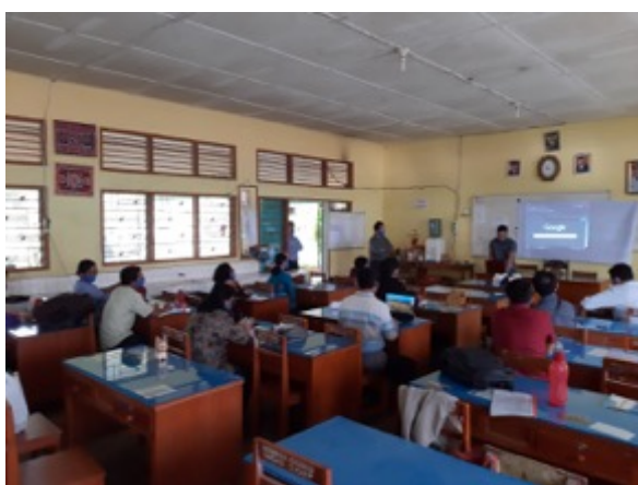
Gambar 11. Suasana Pemaparan Materi oleh Tim Pengabdian

Rangkaian acara selanjutnya adalah Pembukaan dan Sambutan oleh Kepala Sekolah dan Dekan. Kemudian dilanjutkan dengan pemberian materi oleh Tim dan dilanjutkan dengan sesi tanya jawab (quiz interaktif). Setelah itu acara diakhiri dengan sesi foto bersama.