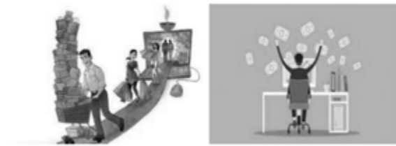
Gambar 7. Tampilan Pemanfaatan Internet di Bidang Komersial