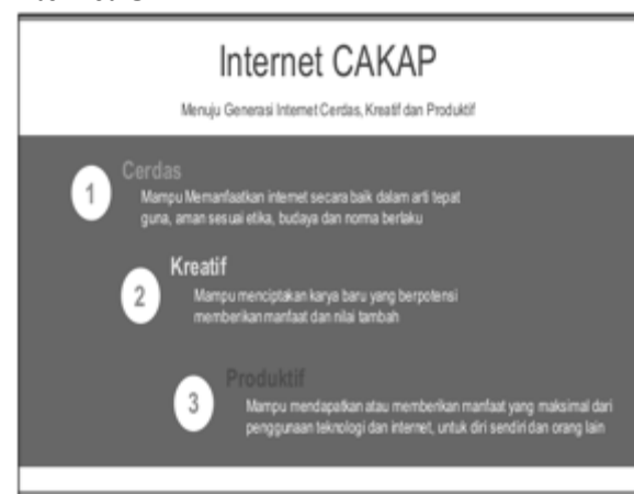
Gambar 3. Tampilan Internet CAKAP