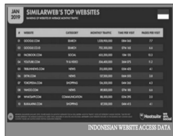
Gambar 2. Tampilan Akses Dat Website Indonesia