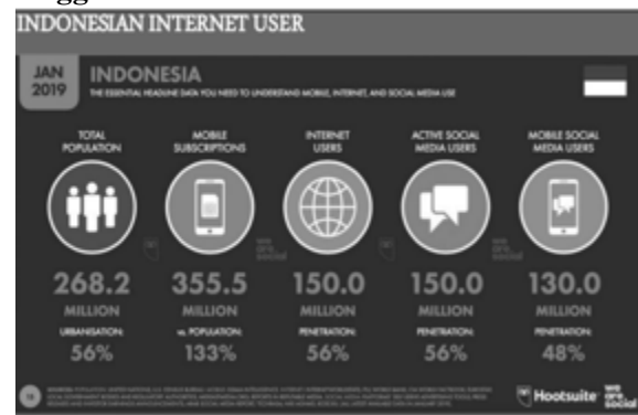
Gambar 1. Tampilan Pengguna Internet di Indonesia