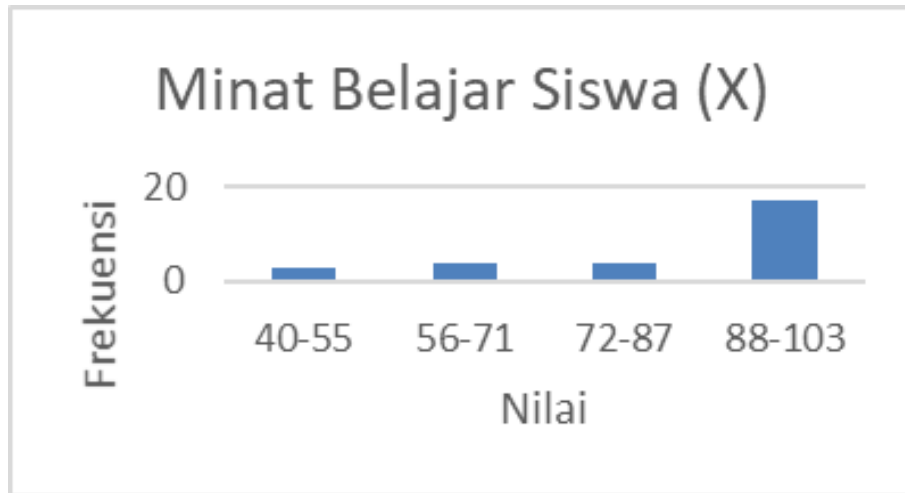
Gambar 1. Diagram Batang Variabel X (Minat Belajar Siswa)