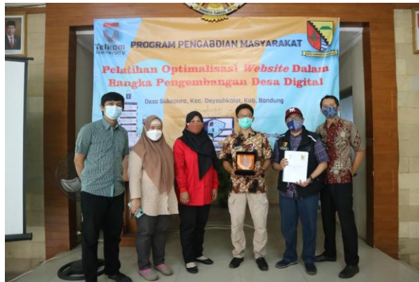
Gambar 1. Pelatihan Perangkat Desa Sukapura

10 September 2021 yang diikuti oleh 3 orang dosen.