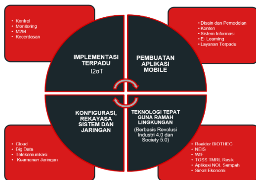
Gambar 5. Roadmap KK Telecommunication Technology

Kegiatan pengabdian masyarakat ini sesuai dengan roadmap KK Telecommunication Technology yaitu untuk Pembuatan Aplikasi untuk Dekstop maupun smartphome. Pembuatan smart incinerator mobile MOS dan sistem informasi atau aplikasi ini dilakukan dalam rangka digitalisasi dengan memanfaatkan potensi dan keunggulan masyarakat sasar. Rencana penelitian Kelompok Keahlian (KK) Telecommunication Technology dijabarkan dalam bidang-bidang berikut.