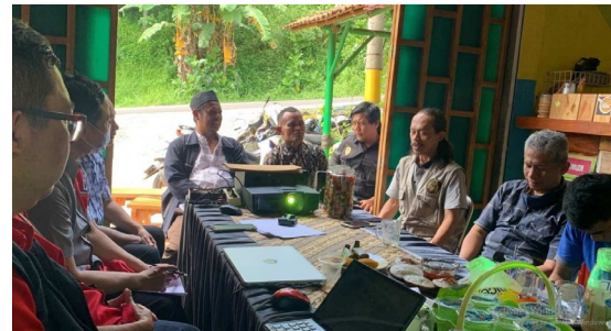
Gambar 3. Penjelasan tentang aplikasi Kelola Sampahku

Sedangkan Gambar 3 dan Gambar 4 menunjukkan beberapa momen kegiatan pelaksanaan pengabdian masyarakat tersebut. Gambar 3 menampilkan kegiatan penjelasan aplikasi Kelola Sampahku di depan beberapa perwakilan dan komunitas masyarakat sasaran. Sedangkan Gambar 4 menunjukkan uji coba mesin mobile incinerator yang telah diterapkan di masyarakat tersebut.