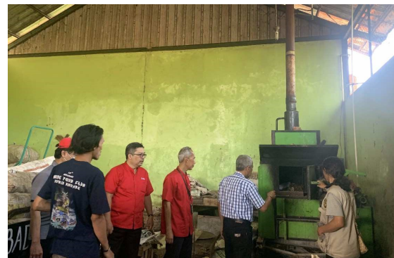
Gambar 4. Tempat pengelolaan sampah anorganik

Kegiatan pengabdian masyarakat ini telah dipublikasikan di YouTube dan di website Prodi D3 Teknologi Telekomunikasi, Fakultas Ilmu Terapan, Universitas Telkom dan di link Youtube: https://www.youtube.com/watch?v=g7xD6zWBWuo .