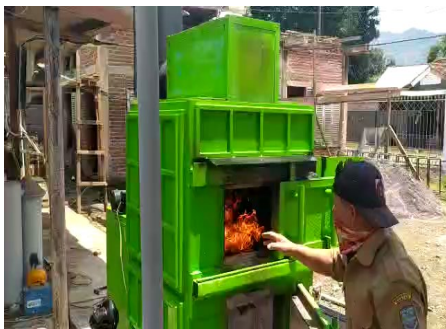
Gambar 1. MOS Incenataror Mobile PKM Kolaborasi

Berikut ini ditunjukkan beberapa luaran kegiatan yang telah dicapai. Gambar 1 menunjukkan mobile incenerator yang telah diterapkan di masyarakat sasaran. Gambar 2 menunjukkan aplikasi kelola sampahku berbasis smartpone android.