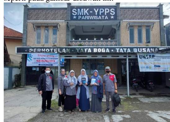
Gambar 2: Pemberian apresiasi dalam bentuk buku dosen FEB dan FKB

Evaluasi dilakukan dengan menggunakan kahoots.com yaitu melalui pertanyaan-pertanyaan konten digital dengan pemberian gimmick pada guru-guru yang berhasil menjadi peringkat teratas seperti pada gambar dibawah ini.