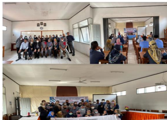
Gambar 4 : Foto Bersama Awal dan Setelah Kegiatan Pembekalan Materi SMK YPPS Sumedang