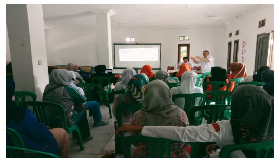
Gambar 1. Penyuluhan dan Simulasi Literasi Keuangan Syariah Keluarga.

yang mudah dipahami oleh masyarakat; tahap implement atau implementasi merupakan tahap uji coba kertas kerja kepada masyarakat yang hadir pada saat penyuluhan dan pelatihan; dan tahap terakhir adalah evaluate atau evaluasi dengan mengumpulkan dan melihat hasil kertas kerja yang dikerjakan oleh masyarakat yang hadir saat penyuluhan dan pelatihan. Sedangkan bagian akhir berupa story telling merupakan bagian dari evaluasi dengan mendengarkan dan menerima masukan dari setiap peserta penyuluhan dan pelatihan seputar peristiwa yang dialami menyangkut rentenir online untuk: 1) membantu masyarakat mengenalkan pada proses dan tujuan dari pengerjaan kertas kerja; 2) memunculkan ide-ide kreatif; 3) meningkatkan kesempatan untuk membangun kemampuan sosial; 4) memunculkan ide-ide yang berasal dari berbagai pengalaman yang dialami (Nurwida, 2016).