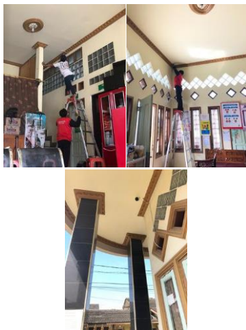
Gambar 4. Titik Pemasangan CCTV