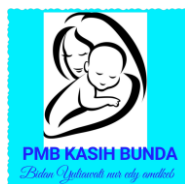
Gambar 1. Logo PMB Kasih Bunda

Kegiatan layanan PMB yang disediakan cukup banyak, misalnya layanan kebidanan untuk pemasangan KB suntik, Intrauterine Device (IUD), imunisasi bayi dan anak-anak, pembantuan proses persalinan, pap smear atau pemeriksaan untuk menguji keberadaan sel-sel kanker, kontrol kehamilan, pemeriksaan ultrasonografi, pil KB, serta layanan buka-pasang implan. Layanan lainnya berupa Post-Partum Treatment atau perawatan pasca melahirkan seperti pijat, lulur, masker untuk ibu, layanan pijat untuk anak-anak, layanan untuk bayi seperti homecare memandikan bayi, cukur rambut bayi, pijat terapi, baby gym , baby swim , serta layanan photo shoot . Setiap harinya jumlah pasien beragam, untuk hari Senin dan Rabu sekitar 40-50 pasien karena jadwal imunisasi dan juga USG praktik bersama dokter, sedangkan hari lainnya sekitar 10-15 pasien. Untuk lebih mengenali tempat praktik PMB Kasih Bunda, pada Gambar 1 terlihat Logo PMB Kasih Bunda.