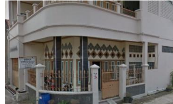
Gambar 2. Tempat Praktik PMB Kasih Bunda

dalam buku laporan harian. Bagian keuangan membuat laporan keuangan pada akhir pekan serta laporan bulanan yang nantinya akan ditujukan kepada pemilik agar mengetahui bagaimana kondisi keuangan pada saat periode yang berjalan. Demikian juga dengan pengawasan klinik selama ini tidak terdapat sistem untuk mengawasi aktivitas di PMB.