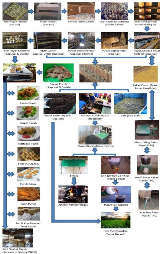
Gambar 2. Hasil Pengabdian Masyarakat Peternakan Puyuh Terintegrasi

Prestasi kegiatan peningkatan akselerasi dan efektifitas program pembangunan dapat dilihat dari bukti lapangan dimana semakin baiknya kualitas kehidupan masyarakat dan semakin meningkatnya partisipasi dan keberdayaan masyarakat dalam pembangunan. Kerjasama yang terintegrasi antara Perguruan Tinggi, Pemerintah Daerah dan Masyarakat memberi dampak pada peningkatan kesejahteraan masyarakat.