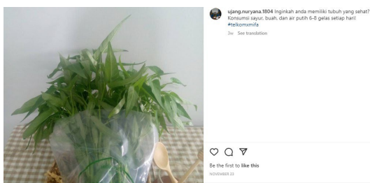
Gambar 1. Hasil foto produk di instagram produk hidroponik Pondok Pesantren Miftahul Falah.

Berikut adalah hasil tangkapan layar foto produk yang dibuat oleh pengurus instagram produk hidroponik dari Pondok Pesantren Miftahul Falah.