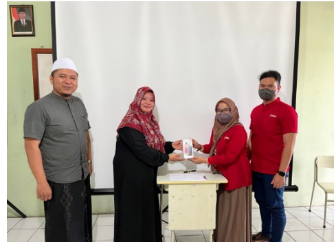
Gambar 6. Pembagian hadiah pembuatan konten terbaik

Sebagai penutup kegiatan ini dilakukan survei terhadap peserta kegiatan sebagai penerima manfaat kegiatan abdimas. Dari survei yang dilakukan didapatkan kesimpulan seluruh peserta kegiatan mendapatkan manfaat dari kegiatan ini.