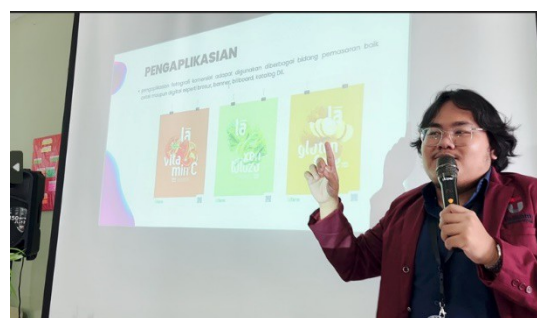
Gambar 2. Materi pelatihan tentang foto produk

Pelaksanaan pelatihan dilakukan selama 1 hari di tanggal 23 November 2022. Peserta kegiatan ini terdiri dari para guru dan santri Pesantren Miftahul Falah. Sekitar 20 orang peserta hadir dalam pelatihan ini. Sesi pertama dalam pelatihan ini adalah pemberian materi mengenai foto produk dan penulisan caption . Pada materi foto produk, peserta diajarkan untuk mengenal apa saja perlengkapan yang dibutuhkan dan bagaimana angle (sudut kamera) yang menarik dalam foto produk.