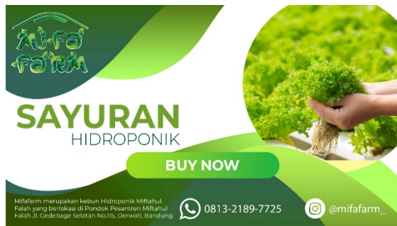
Gambar 8. Hasil Foto produk dan Copywriting

Kegiatan ini menjadi masukan positif dan diharapkan mampu meningkatkan penjualan produk