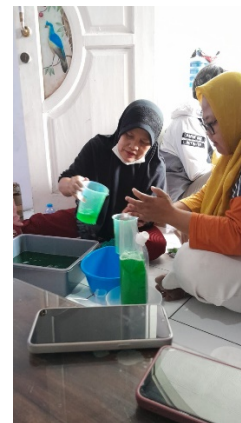
Gambar 3 Proses produksi sabun oleh kader PKK

Proses produksi sudah dapat dilakukan secara mandiri oleh pada kader PKK dan BUMDES dengan waktu fleksibel menyesuaikan dengan kegiatan ibu rumah tangga secara umum. Proses produksi ini telah dimulai sejak akhir Oktober 2022. Jumlah dan tipe kemasan yang diproduksi menyesuaikan dengan pemesanan. Gambar 3 memperlihatkan foto ibu-ibu kader PKK yang sedang mengemas sabun dan Gambar 4 memperlihatkan foto sabun hasil produksi dalam kemasan 150 mL, 500 mL, dan 1000 mL.