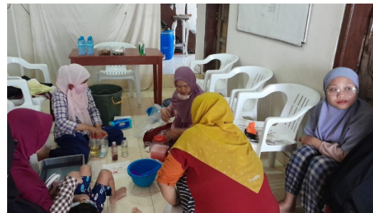
Gambar 2 Proses mencoba resep sabun

Proses produksi sudah dapat dilakukan secara mandiri oleh pada kader PKK dan BUMDES dengan waktu fleksibel menyesuaikan dengan kegiatan ibu rumah tangga secara umum. Proses produksi ini telah dimulai sejak akhir Oktober 2022. Jumlah dan tipe kemasan yang diproduksi menyesuaikan dengan pemesanan. Gambar 3 memperlihatkan foto ibu-ibu kader PKK yang sedang mengemas sabun dan Gambar 4 memperlihatkan foto sabun hasil produksi dalam kemasan 150 mL, 500 mL, dan 1000 mL.