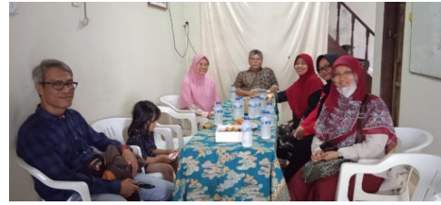
Gambar 1 Foto koordinasi dengan PKK, BUMDES, dan Ketua RW

tutorial kepada para kader PKK. Gambar 2 memperlihatkan proses percobaan pembuatan sabun. Setelah sabun berhasil dibuat dengan hasil baik kemudian dilanjutkan dengan proses produksi.