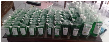
Gambar 4 Sabun hasil produksi

diberikan contoh sabun cuci piring kemasan 150 mL. Gambar 5 memperlihatkan foto kegiatan sosialisasi dan penyerahan contoh sabun cuci piring.