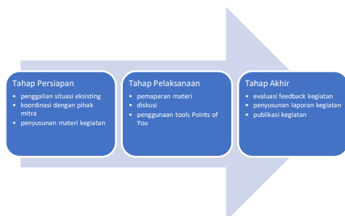
Gambar 1. Tahapan Kegiatan

Terdapat tiga tahapan dalam pelaksanaan kegiatan yang terdiri dari tahap persiapan, tahap pelaksanaan, serta tahap akhir. Gambaran umum mengenai setiap tahapan yang dilakukan diperlihatkan pada Gambar 1.