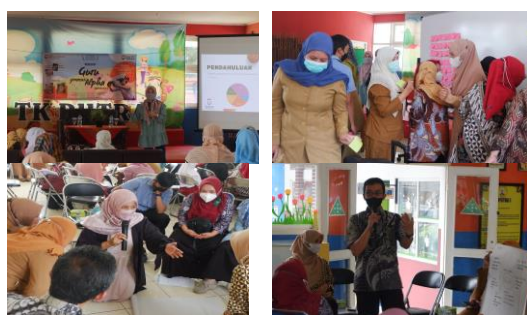
Gambar 2. Dokumentasi Kegiatan

Kegiatan dilaksanakan secara tatap muka dengan tetap mempertimbangkan protokol Kesehatan seperti penggunaan masker bagi seluruh peserta dan panitia. Dokumentasi dari rangkaian kegiatan pengabdian masyarakat dapat dilihat pada Gambar 2. Para guru sebagai peserta antusias dalam mengikuti rangkaian kegiatan serta berpartisipasi secara aktif pada setiap sesi diskusi yang dilakukan.