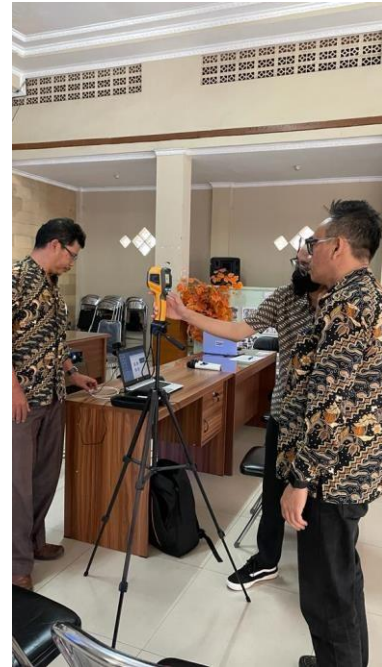
Gambar 2. Dokumentasi pemasangan perangkat

Hasil yang telah dicapai pada kegiatan ini adalah telah dipasang perangkat pemeriksaan suhu badan dengan citra termal sesuai protokol COVID-19 di Kantor Desa Sukapura.