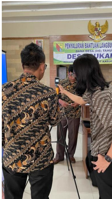
Gambar 4. Pengoperasian perangkat

Kemudian kegiatan dilanjutkan dengan petunjuk pengoperasian perangkat dengan cara praktek langsung menggunakan termal kamera untuk mendeteksi suhu badan manusia di ruangan dan bagaimana cara mengoperasikan fitur-fiturnya seperti arah dan jarak ke objek yang dideteksi sampai ke perekaman gambar.