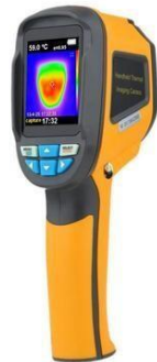
Gambar 1. Thermal Imaging Camera HTI-HT02 Berikut ini adalah spesifikasi dari perangkat yang digunakan pada kegiatan ini.

menggunakan Thermal Imaging Camera HTIHT02 yang sudah diproduksi oleh industri yang telah diuji produk dan sesuai standar produk nasional.