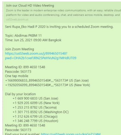
Gambar 2 Zoom Meeting ID

atas permasalahan tersebut. Kesepakatan antara tim dosen Politeknik LP3I Jakarta dengan PKBM 11 Manggarai, Jakarta Selatan mengenai pelaksanaan pelatihan dalam kondisi pandemi covid-19 yaitu kegiatan akan dilaksanakan secara online melalui aplikasi Zoom Meeting yang dimiliki oleh Politeknik LP3I Jakarta. Id meeting dan password yang disebarkan dan digunakan adalah sebagai berikut: