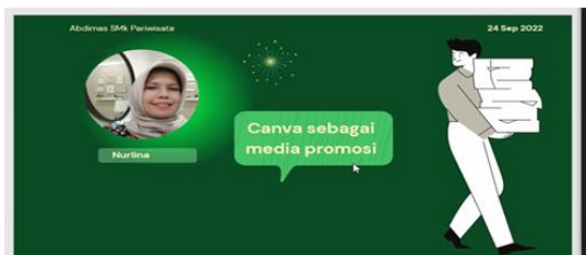
Gambar 2 Pembukaan Acara Pelatihan