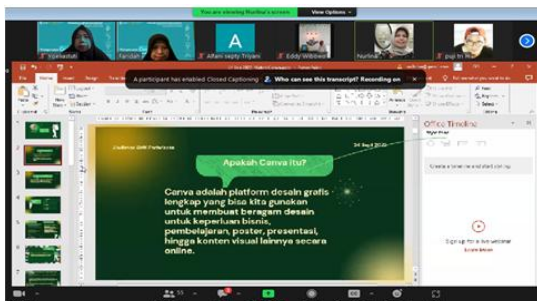
Gambar 3 Penjelasan Materi Teori