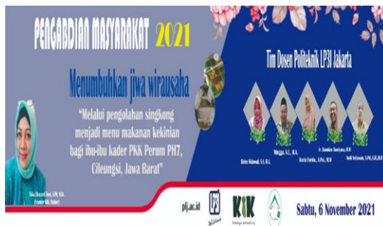
Gambar 3 Spanduk Kegiatan

Pedagang berbeda dengan wirausahawan. Dengan bekal kewirausahaan, seorang pedagang dapat menjadi pengusaha sukses. Wirausahawan merupakan batu loncatan menjadi pengusaha.