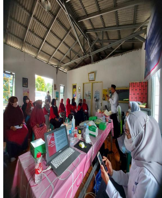
Gambar 5 Dokumentasi Kegiatan

Berikut dokumen panitia dan para peserta penyuluhan.