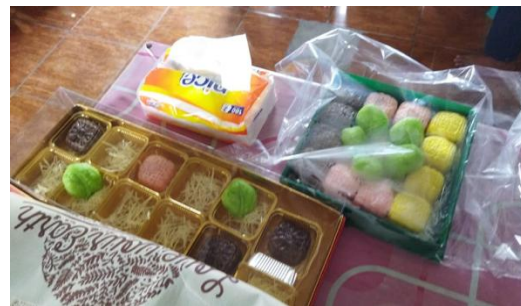
Gambar 1 Produk Olahan PKK

Pandemi Covid 19 yang belum kunjung usai menyebabkan mundurnya roda perekonomian atau mengalami kesulitan keuangan. Hal ini juga dirasakan bagi para keluarga di PH 7.