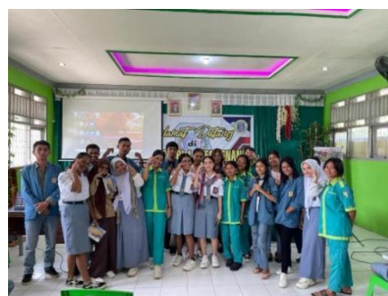
Gambar 3. Didalam aula foto Bersama siswa/i setelah melakukan sosialisasi