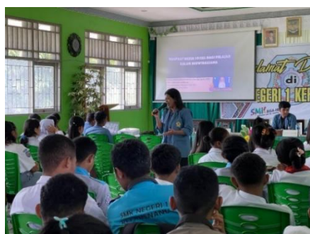
Gambar 2. Didalam aula saat melakukan sosialisasi

Tahap pertama dalam melangsungkan kegiatan sosialisasi ini mahasiswa melakukan survei ke sekolah-sekolah untuk menentukan target sosialisasi. Setelah melakukan survei mahasiswa memutuskan untuk memilih SMKN 1 Kefamenanu sebagai tempat sosialisasi. Alasan kami memilih SMKN 1 Kefamenanu sebagai target dalam sosialisasi ini dikarenakan SMKN 1 merupakan bagian dari Kelurahan Sasi tempat Mahasiswa melangsungkan kegiatan KKNT-PPM dan juga ini merupakan pengabdian Mahasiswa kepada masyarakat khususnya kepada Siswa/I yang duduk dibangku sekolah. Sebelum melakukan kegiatan sosialisasi kami memberikan surat undangan pada tanggal 21 Januari 2023, melakukan penyusunan program kegiatan sekaligus menyusun dan mempersiapkan materi sebagai bahan sosialisasi kepada para pelajar, sehingga para pelajar tidak bosan dan bisa mengerti dengan materi yang di paparkan oleh mahasiswa.