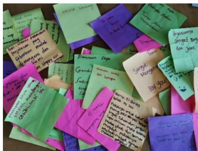
Gambar 6. foto sticky notes yang di tulis oleh siswa/I SMKN 1 Kefamenanu

Setelah melakukan sosialisasi banyak pelajar yang tertarik untuk berwirausaha menggunakan media sosial dan lebih memanfaatkan waktu untuk melakukan hal-hal yang baik dalam menggunakan media sosial.