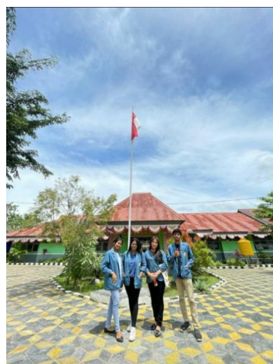
Gambar 5. setelah melakukan sosialisasi foto di halaman sekolah