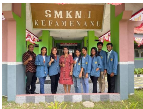
Gambar 4. foto bersama kepala sekolah dan guru