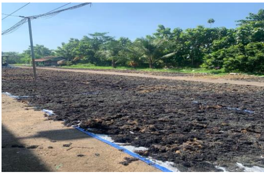
Gambar 3. Proses pengeringan rumput laut di Desa Tanjungsari

Rumput laut yang sudah kering dan siap diolah, masih perlu dibersihkan lagi. Caranya, dicuci dengan air mengalir hingga semua garam, debu dan kotoran hilang. Dalam proses ini boleh ditambahkan tepung/ jeruk lemon untuk menghilangkan bau. Selanjutnya, direndam dengan air bersih semalaman.