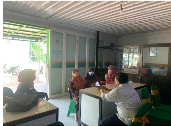
Gambar 1. Survei Lokasi

yaitu lingkungan internal dan lingkungan eksternal. Selanjutnya dari analisis tersebut, maka dibentuk usulan analisis berupa strategi yang sesuai diterapkan, yaitu strategi S-O ( strength-opportunity ), W-O ( weakness-opportunity ), S-T ( strength-threats ), W-T ( weakness-threats ).