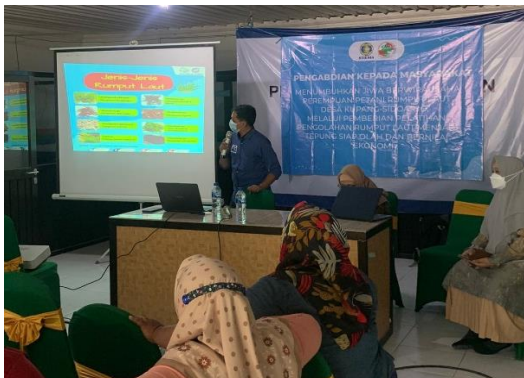
Gambar 4. Pemaparan materi rumput laut

Rumput laut yang sudah kering dan siap diolah, masih perlu dibersihkan lagi. Caranya, dicuci dengan air mengalir hingga semua garam, debu dan kotoran hilang. Dalam proses ini boleh ditambahkan tepung/ jeruk lemon untuk menghilangkan bau. Selanjutnya, direndam dengan air bersih semalaman.