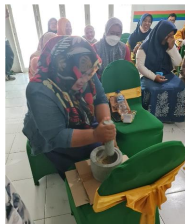
Gambar 7. Menghaluskan rumput laut

Terakhir, bersama-sama (narasumber, tim pengabdi STIESIA dan para peserta) praktek menghaluskan rumput laut kering menggunakan alat sederhana, dalam kegiatan ini menggunakan lumpang. Tujuannya adalah agar para peserta tidak serta merta berpatokan pada hal-hal yang dirasa sulit, dengan menggunakan alat sederhana yang ada di dapur juga bisa.