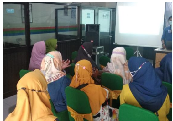
Gambar 6. Tanya jawab dan Diskusi

Dalam sesi ini, Peserta mulai aktif bertanya dan sharing/ konsultasi terkait ide bisnis.