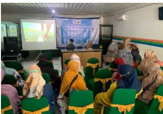
Gambar 5. Pemaparan materi kewirausahaan

Materi kewirausahaan berisi wawasan terkait keuntungan berwirausaha, peluang-peluang bisnis saat ini dan upaya bisnis dengan mengelola produk unggulan. Materi ini juga memaparkan video-video inspiratif para pebisnis baik dari luar negeri maupun dalam negeri. Hal ini untuk menumbuhkan minat berwirausaha para petani rumput laut.