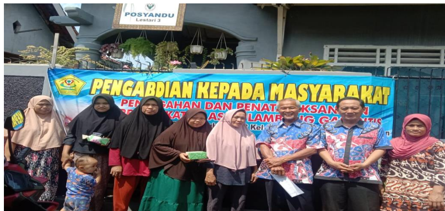
Gambar 3. Foto Bersama