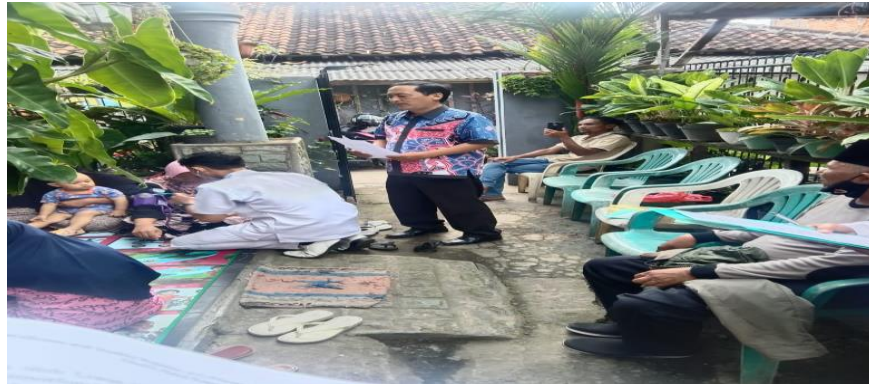
Gambar 2. Kegiatan Penyampaian Materi