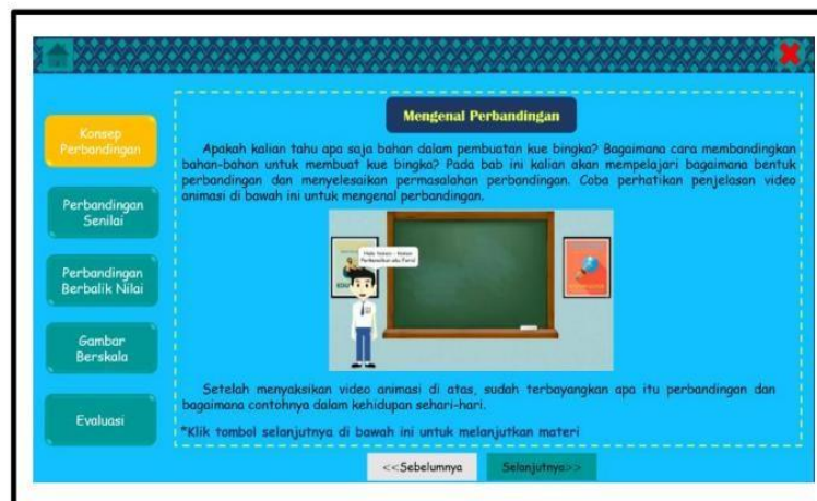
Gambar 3 Contoh Tampilan Halaman Materi yang Memuat Video

Pada paparan materi, selain berisi teks uraian materi pada beberapa halaman dilengkapi dengan narasi berupa video yang dibuat dari slide powerpoint dan wondershare filmora. Tampilan halaman materi terdapat pada Gambar 3 berikut.