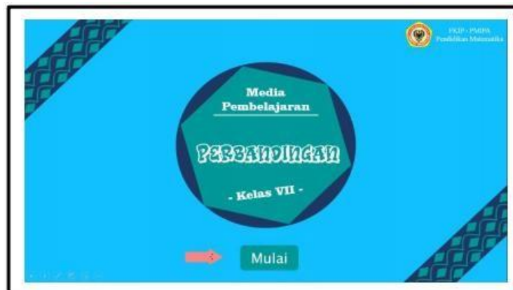
Gambar 1 Tampilan Halaman Depan

Media pembelajaran digital yang dikembangkan memuat (1) Halaman depan media pembelajaran digital; (2) menu utama; (3) KI, KD, Peta Konsep; (4) info; (5) petunjuk media; (6) materi dan kuis; dan (7) evaluasi. Tampilan cover media pembelajaran pada Gambar 1 berikut.