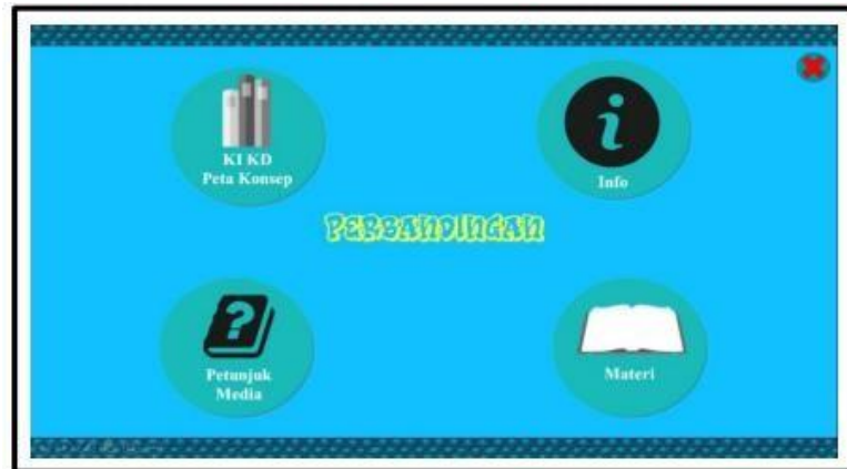
Gambar 2 Tampilan Halaman Menu Utama

Pada paparan materi, selain berisi teks uraian materi pada beberapa halaman dilengkapi dengan narasi berupa video yang dibuat dari slide powerpoint dan wondershare filmora. Tampilan halaman materi terdapat pada Gambar 3 berikut.