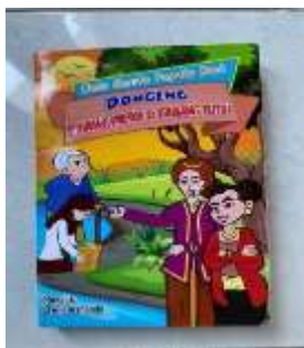
Gambar 2. Desain Awal

Validasi ahli media bertujuan untuk menilai aspek tampilan visual media pembelajaran. Aspek dalam media yang dikembangkan dan divalidasi oleh Dosen Prodi PGSD yaitu Bapak Sutrisno Sahari, S.Pd.,M.Pd. selaku dosen Media Pembelajaran di Universitas Nusantara PGRI Kediri dengan menggunakan skala 1 sampai 5. Berdasarkan Kriteria menurut Riduwan (2015:15) jika persentase 81% - 100% termasuk dalam kriteria sangat valid dan sangat baik digunakan, sedangkan analisis data validasi ahli media menunjukkan \frac{46}{50} \times 100 = 92\% . Jadi, dapat disimpulkan bahwa media pembelajaran Pop-Up Book sangat baik digunakan.