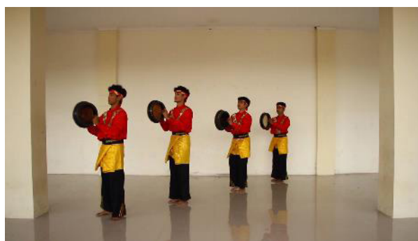
Gambar 7. Karya tari Hoka Rapai

kunjungan secara berkala untuk melihat keberlanjutan hasil penelitian. Mitra penelitian diharapkan dapat menjadi role model sanggar/komunitas tari dalam hal mencipta tari inovatif yang bersumber dari kesenian tradisi guna meningkatkan produktifitas dan eksistensi. Sehingga kegiatan pelatihan serupa dapat dilakukan di masa mendatang dengan melibatkan Lembaga Buana sebagai sanggar/komunitas percontohan dan menghadirkan peserta dari berbagai sanggar/komunitas seni yang memiliki permasalahan yang sama.