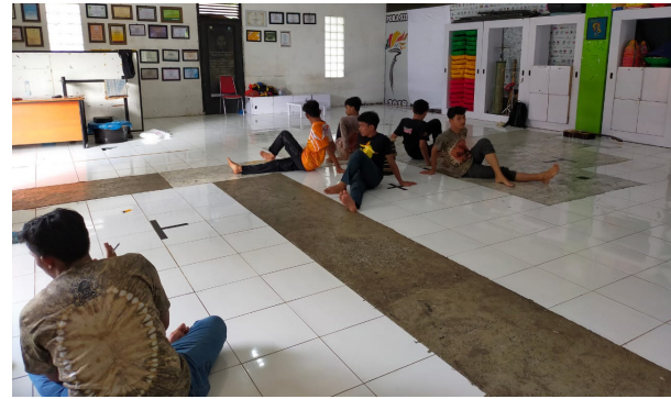
Gambar 6. Presentasi peserta pelatihan

Tahapan ini menjadi bagian penilaian indikator keberhasilan penelitian yang dilaksanakan. Peserta pelatihan akan melakukan presentasi hasil kerja mandiri