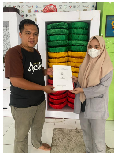
Gambar 2. Penyerahan modul pelatihan

multimedia di Institut Seni Budaya Indonesia Aceh. Hingga akhirnya materi dicetak dan memperoleh pengesahan dari Ketua Lembaga Penelitian, Pengabdian kepada Masyarakat dan Penjaminan Mutu Pendidikan ISBI Aceh.