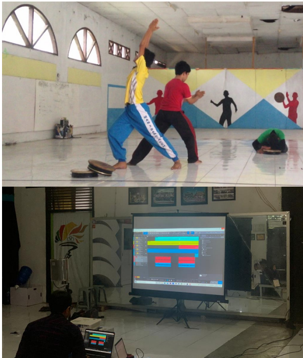
Gambar 5. Proses penataan gerak dan musik oleh peserta

sesuai dengan alur yang diinginkan peserta.