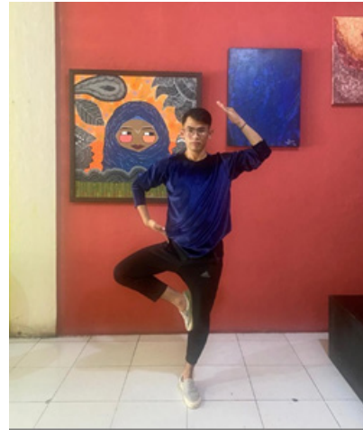
Gambar 1. Proses pembuatan modul pelatihan

Materi modul pelatihan kemudian dikoreksi ulang bersama tim peneliti dengan meminta pendapat dan saran rekan sejawat pada bidang keahlian koreografi dan musik