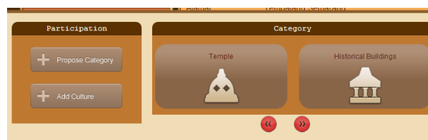
Gambar 1. Menu pengunggahan file multimedia

Realisasi yang dihasilkan dari penelitian ini adalah adanya penambahan di dalam sistem yang memungkinkan untuk mengunggah file multimedia tentang budaya yang disimpan di dalam database. File multimedia ini dapat berupa gambar maupun video yang dapat memvisualisasikan warisan budaya tangible .