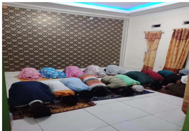
Gambar 3. Dokumentasi Kegiatan Fiqih Ibadah (Praktik Sholat)