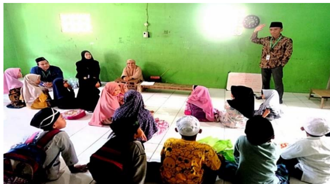
Gambar 2. Dokumentasi Kegiatan Belajar