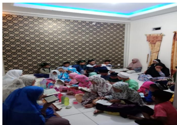
Gambar 3. Dokumentasi Kegiatan Pengajian