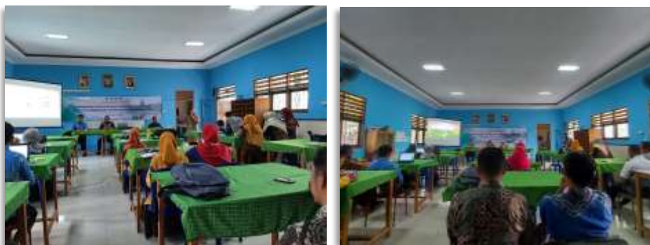
Gambar 1. Pembukaan Acara oleh Kepala Sekolah SMP Negeri 14 Banjarbaru

Kegiatan PkM diawali dengan pembukaan oleh Kepala Sekolah SMP Negeri 14 Banjarbaru, kemudian Pengawas Sekolah memberikan sedikit pengarahan kepada guru-guru terkait tugas yang harus dijalankan oleh seorang guru. Hal ini didokumentasikan pada Gambar 1.