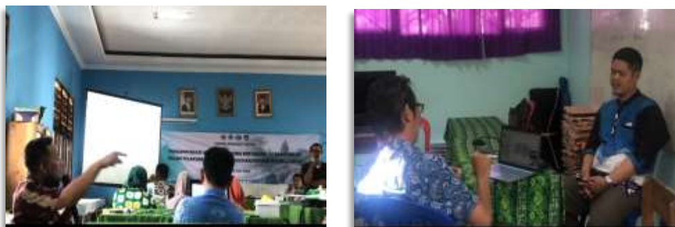
Gambar 4. Sesi Diskusi

Kegiatan ini, berjalan dengan lancar terlihat dari antusias peserta pada saat menyimak dan bertanya pada sesi diskusi. Sesi diskusi tersebut di dokumentasikan pada Gambar 4.