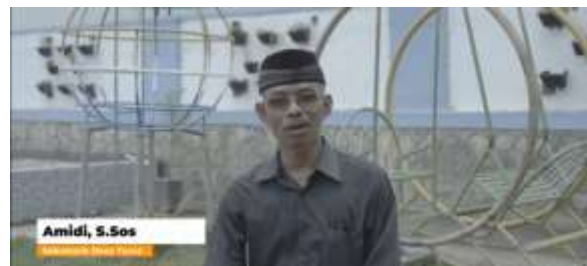
Gambar 4. Sekretaris Desa Turus