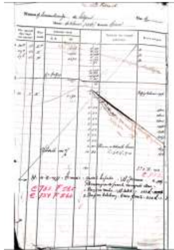
Gambar 5. Dokumen arsip tanah Desa Turus