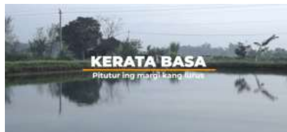
Gambar 3. Makna kata turus