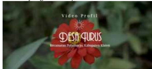
Gambar 2. Opening video profil Desa Turus

juga berharap dengan adanya video profil tersebut bisa mengundang investor untuk pembangunan Desa Turus yang lebih maju.