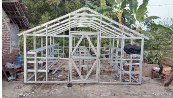
Gambar 4. Greenhouse Baja Ringan

selesai, paranet 80 % digunakan sebagai selubung greenhouse, serta dilakukan pemasangan selang dan nozel untuk spray air dingin yang ditunjukkan pada gambar 5.