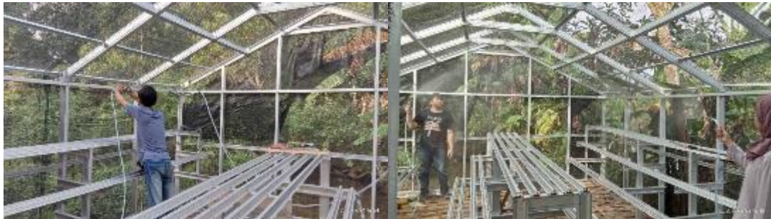
Gambar 5. Pemasangan selang dan nozel

Setelah greenhouse telah selesai dibuat, pada gambar 6 menunjukkan sistem refrigerasi dalam bentuk trainer didatangkan untuk kemudian dilakukan instalasi kontrol kelembaban dan perakitan selang spray agar sistem bekerja secara otomatis, dimana kelembaban dijaga dengan set poin 80 - 90%. Setelah semua terpasang, dilakukan uji coba alat yang diawali dengan proses pendinginan air dalam box hingga mencapai temperatur yang direncanakan yaitu 17 °C. Setelah temperatur tercapai, kontrol kelembaban mulai dijalankan. Apabila kelembaban dalam greenhouse di bawah 80%, maka secara otomatis motor spray bekerja dan meningkatkan kelembaban dalam ruang greenhouse yang secara otomatis juga menurunkan temperatur. Spray air dingin akan berhenti jika kelembaban ruang greenhouse telah mencapai 90%. Uji coba dilakukan dari pukul 08.00 sampai dengan 16.00 selama 3 hari.