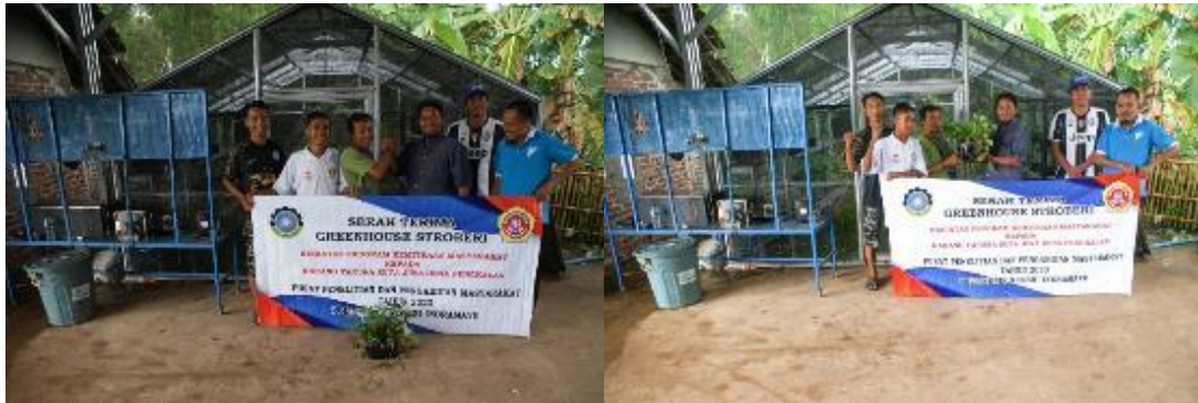
Gambar 9. Serah terima greenhouse stroberi

Akhir dari kegiatan PkM adalah serah terima greenhouse stroberi yang dilakukan oleh ketua Tim PkM kepada mitra yang diwakili oleh Ketua dan jajaran pengurus karang taruna Desa Pangkalan sebagaimana ditunjukkan pada gambar 9.