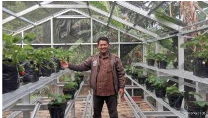
Gambar 7. Tanaman stroberi dalam greenhouse