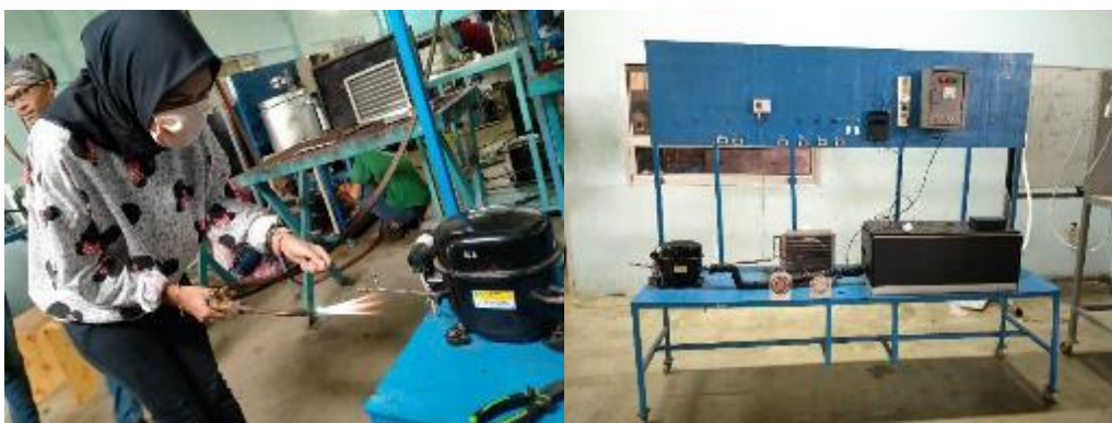
Gambar 3. Desain rekayasa iklim pada greenhouse

Tahapan awal yang dilakukan dalam pelaksanaan Pengabdian masyarakat ini adalah merakit komponen sistem refrigerasi yang akan digunakan untuk mendinginkan air dalam box sebagaimana ditunjukkan pada gambar 3. Komponen utama yang digunakan yaitu kompresor, kondensor, pipa kapiler, serta evaporator yang dicelupkan pada box berisi air. Perakitan ini dilakukan di lab. Teknik Pendingin dan Tata Udara Politeknik Negeri Indramayu.