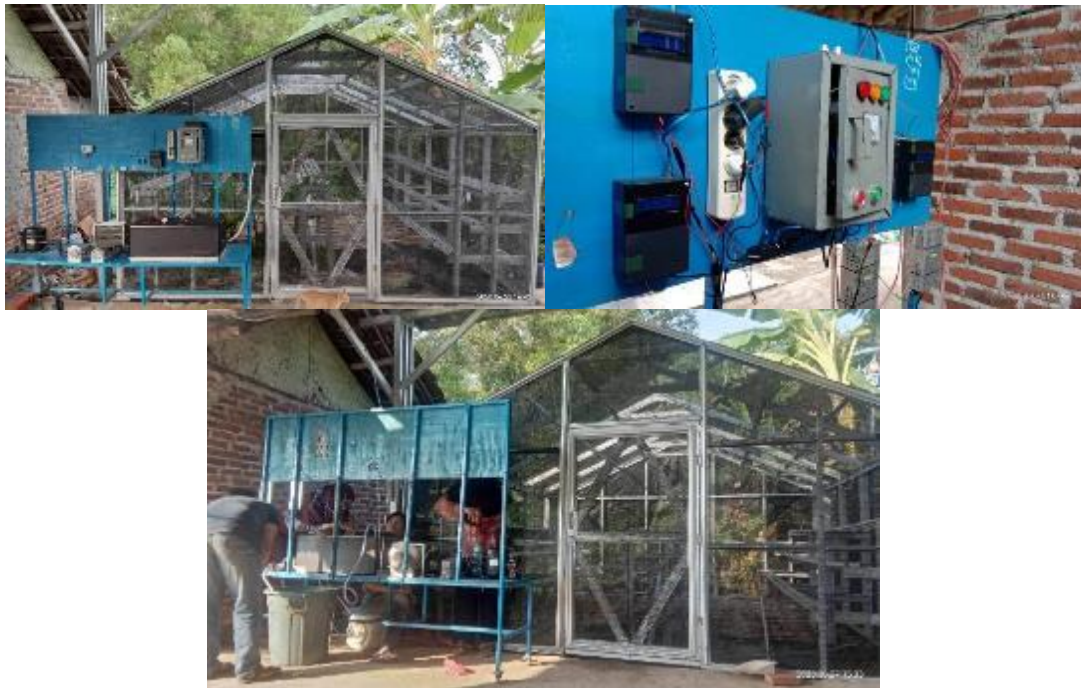
Gambar 6. Pembuatan kontrol dan pengujian sistem