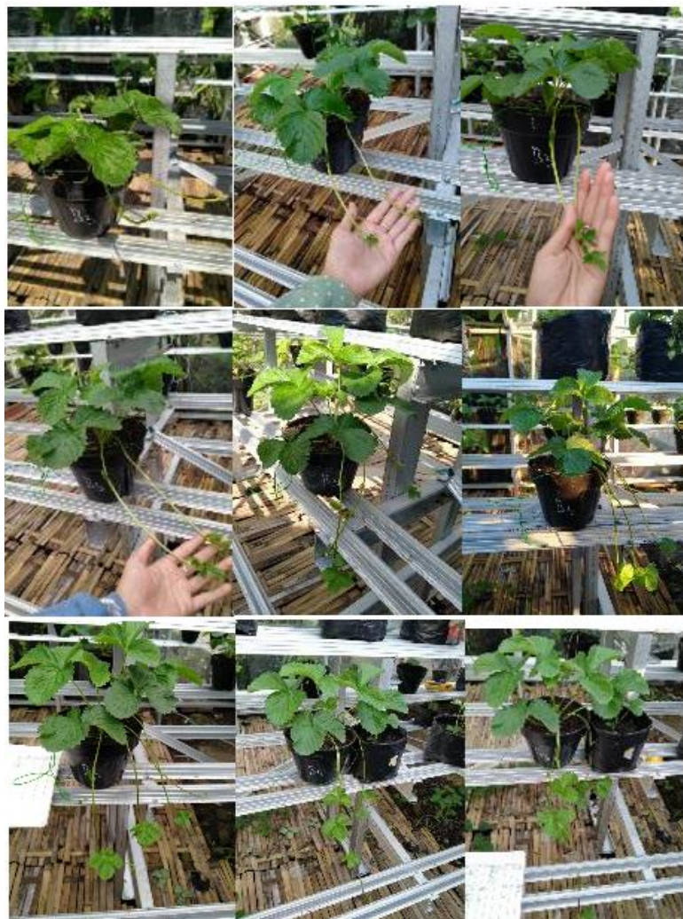
Gambar 8. Perkembangan stolon dan daun stroberi

Stolon adalah perpanjangan tunas strawberry yang tumbuh horizontal sejajar dengan permukaan tanah (menjalar), yang merupakan organ perbanyakan vegetatif. Pengamatan panjang stolon dan tunas stroberi dilakukan selama 12 hari sejak berada dalam greenhouse.