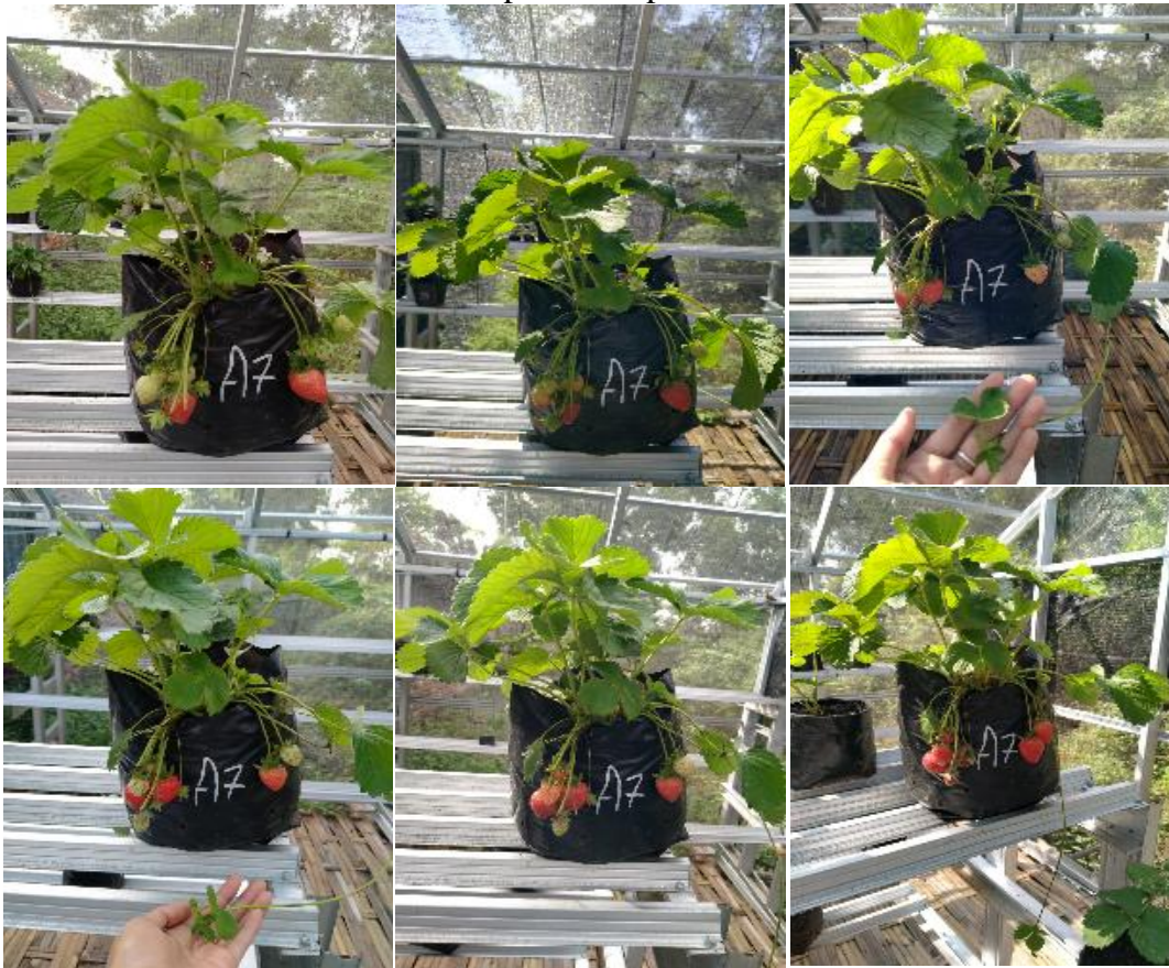
Gambar 9. Perkembangan buah stroberi

Pengamatan pada buah stroberi dilakukan selama 6 hari, dimana pada hari pertama nampak hanya 2 buah yang memiliki warna merah muda sebagaimana ditunjukkan pada gambar 9. Perubahan warna buah terjadi setiap hari dan pada hari ke 6 nampak semua buah telah berwarna merah tua dan siap untuk dipanen.