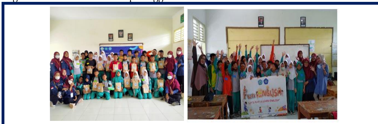
Gambar 3. Pemberian Hadiah kepada siswa

tegalurung yang dulunya tidak bersemangat dan tidak menyukai bahasa Inggris, sekarang mereka senang dengan bahasa Inggris, dan mereka berharap kegiatan pembelajaran “Fun English” ini terus dilakukan tiap minggu.