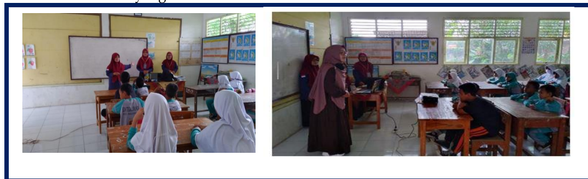
Gambar 1. Ketika Dosen Pendamping dan team memepkenalkan diri

Dalam kegiatannya, Fun English merancang Materi yang sesuai dengan level Pendidikan mereka. Setelah mengumpulkan informasi dari berbagai sumber seperti kurikulum siswa SD dan buku-buku teori terkait pengajaran Bahasa Inggris didapatlah materi tensis dan kosa kata yang sesuai untuk level anak SD.