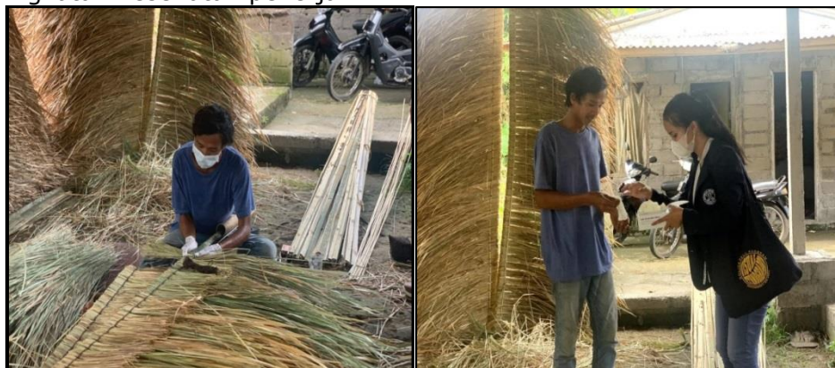
Gambar 2. Pemberian APD (Alat Pelindung Diri) kepada pekerja