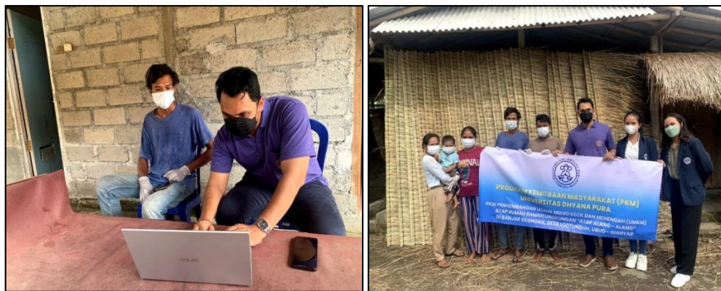
Gambar 4. Pelatihan manajemen keuangan secara komputerisasi

komputerisasi, hanya beberapa (10%) dari mereka yang paham dalam mengoperasikan system. Setelah dilakukan pelatihan penggunaan system 60% pekerja mampu mengoperasikan system keuangan. Hal ini memang tidak mudah perlu pelatihan secara rutin yang dilakukan oleh pengabdian. Dengan penggunaan system dalam pengelolaan keuangan, mitra bisa dengan mudah mengetahui jumlah penjualan, pemasukan dan pengeluaran sehingga system penggajian juga bisa diatur selayaknya kepada pekerja.