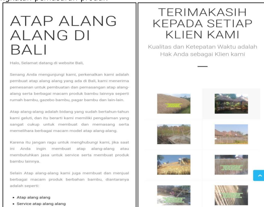
Gambar 3. Template website atap alang-alang

Hasil observasi sebelum serta sesudah pemasaran produk melalui website menunjukkan peningkatan dari 35% menjadi 90% produk terjual. Sebelum PKM Pemasaran atap alang-alang masih minim dan hanya menyasar pasar lokal yang dipasarkan di daerah produksi. Sebagian besar Masyarakat masih berpikir bahwa atap alang-alang mudah rusak dibandingkan produk lain. Setelah dipasarkan melalui website hasil penjualan meningkat drastis. Permintaan diluar daerah produksi meningkat (60% dari dalam Kabupaten, 90% luar Kabupaten dan 70% luar Provinsi).