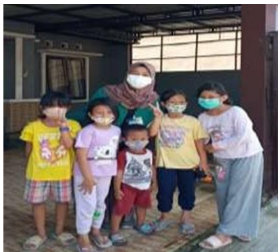
Gambar 4. Edukasi kepada anak-anak tentang pentingnya menggunakan masker