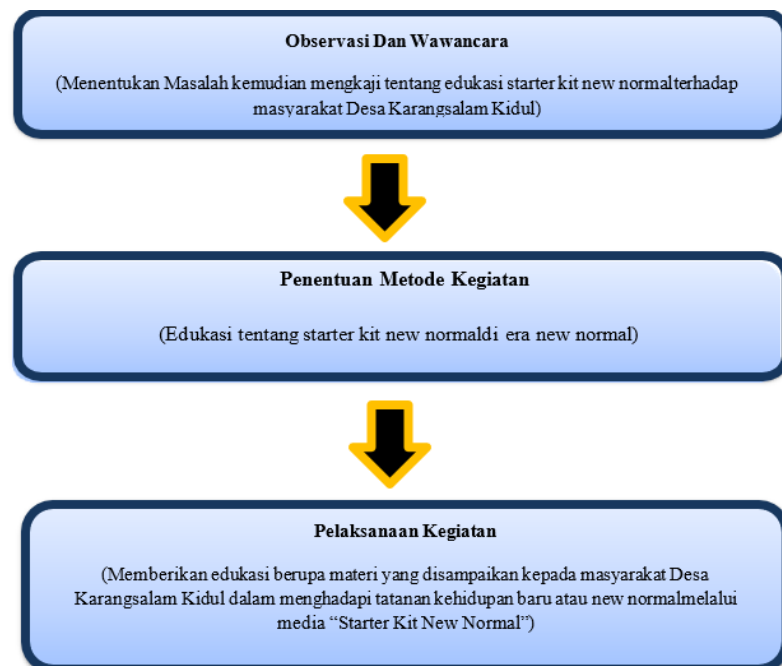
Gambar 1. Alur Pelaksanaan

Metode yang digunakan didalam kegiatan ini adalah penyuluhan dan edukasi. Media yang digunakan adalah starter kit new normal, Kegiatan ini dilaksanakan bulan Juli 2021 dengan menerapkan protokol kesehatan. Adapun tahapan pelaksanaan kegiatan sebagai berikut: