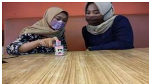
Gambar 3. Pemberian Edukasi Starter Kit New Normal Berupa Hand Sanitizer

Gambar dibawah ini sedang dilakukan edukasi terkait starter kit new normal, yakni Hand Sanitizer kepada salah satu warga Desa Karangsalam Kidul. Starter kit new normal adalah salah satu media yang mana digunakan ketika hendak beraktivitas di luar disaat kondisi pandemic virus COVID-19, seperti saat ini.