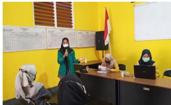
Gambar 2. Wawancara dan Observasi

Kegiatan pada gambar ini sedang dilakukan observasi dan wawancara tentang starter kit new normal kepada masyarakat Desa Karangsalam Kidul.